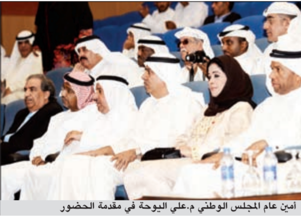
أمين عام المجلس الوطني م.علي اليوحة في مقدمة الحضور