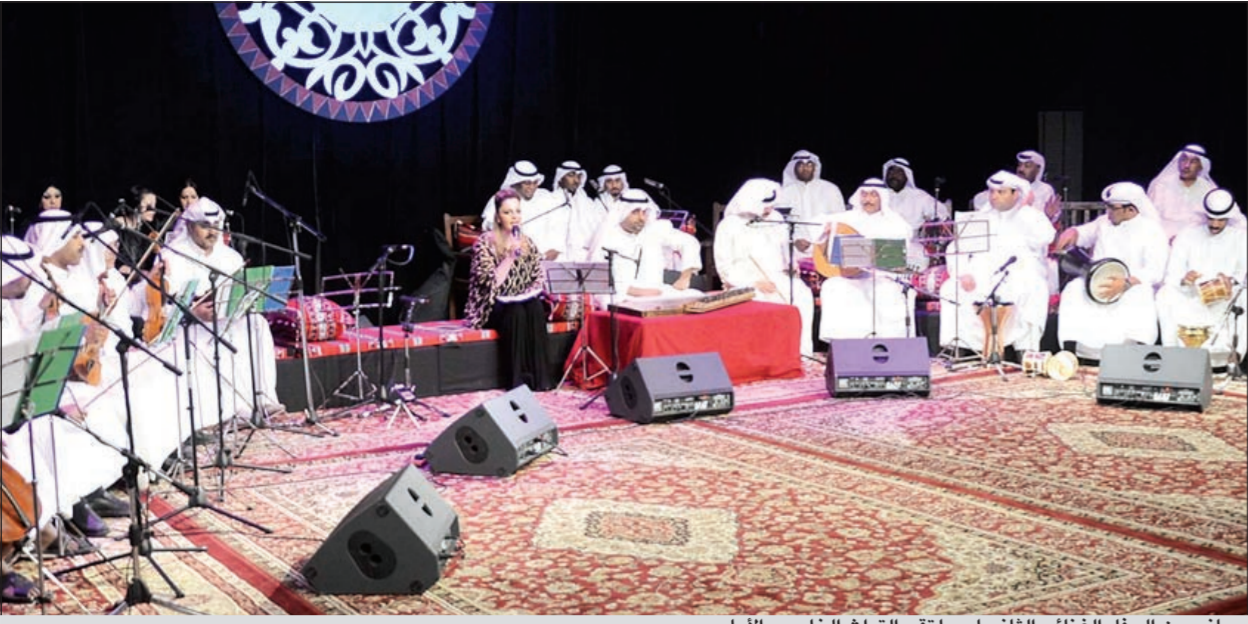
جانب من الحفل الغنائي الثاني لـ «ملتقى التراث الخليجي الأول»