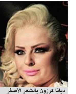
ديانا كرزون بالشعر الأصفر

لاتزال ديانا كرزون منشغلة بتغيير «لوكةا» من فترة إلى أخرى، والبحث عن كل ما هو غريب ولافق، حتى أن المغنية الأردنية صارت مهووسة بهذا الأمر، خصوصا أنه منذ تخرجها فمن برنامج «سوبر ستار» منذ أكثر من سبع سنوات، بدت، بحسب ما ذكر موقع «انا زهرة»، عاجزة عن رسم مسار فني خاص بها رغم موهبتها الصوتية.