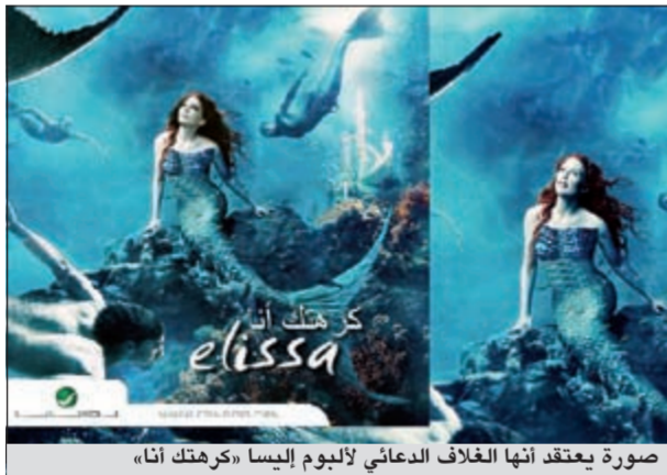
صورة يعتقد أنها الغلاف الدعائي لألبوم إليسا «كرهت أنا»