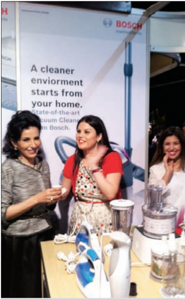
الشيخة فريال تتفقد بعض المعارضات

رعت شركة علي عبد الوهاب وأولاده وشركاهم بعلاقتها التجارية Bosch للأجهزة المنزلية معرض «هلا رمضان إكسبو 2» الذي أقيم في مول 360 ما بين 22 و25 أبريل 2012 تحت رعاية الشيخة فريال الصباح. و«Bosch» هي العلامة الوحيدة للأجهزة المنزلية المشاركة في «هلا رمضان إكسبو 2» والتي تعرض أحدث موديلات من الأجهزة المنزلية الصغيرة التي تشمل أجهزة إعداد الطعام والإفطار وأجهزة إعداد القهوة، وأجهزة العناية بالأرضيات، وأجهزة العناية بالملابس وأجهزة العناية بجمال البشرة والشعر.