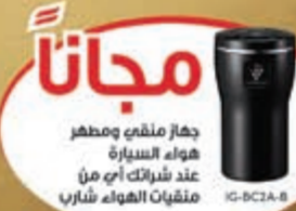
جهاز ملقى ومطهر هواء السيارة عند شاركتك أي من ملقحات الهواء شاراب

كل يوم، نستنشق أكثر من 11,000 لتر من الهواء غير النقي.