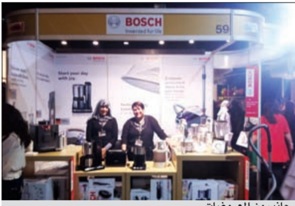
جانب من المعارضات