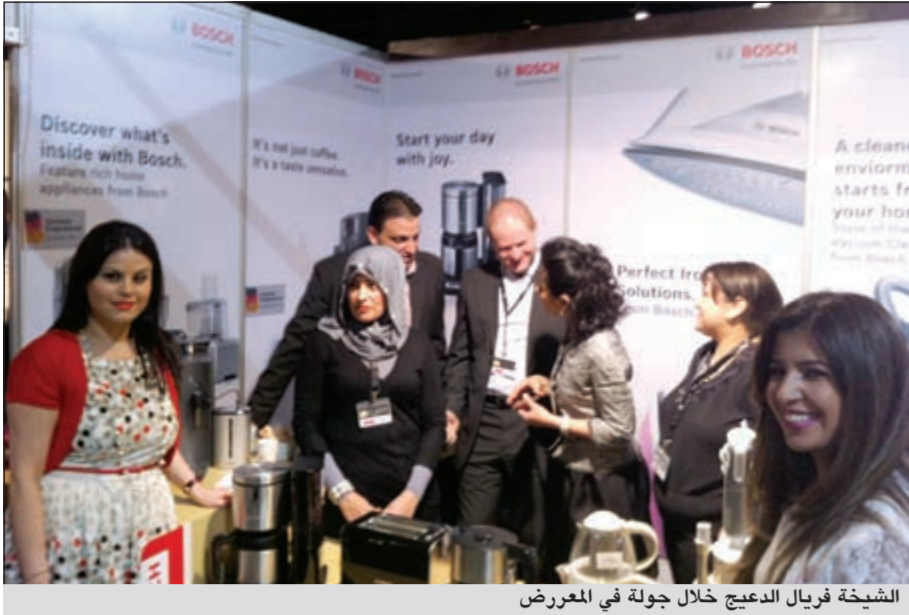
الشيخة فريال الدعيج خلال جولة في المعرض