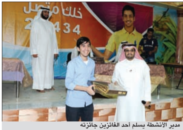
مدير الأنشطة يسلم أحد الفائزين جائزته