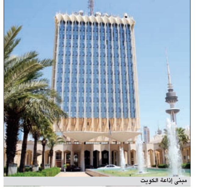
مبنى إذاعة الكويت

المسؤول عن هذه الاصوات: أيسن الوزير والوكيل والمدير والمخرج؟ وفي النهاية أيسن المذيع او بالأحرى الذي أصبح مذيعا بالواسطة؟، خصوصا ان بعض اصوات المذيعين أسوأ من صوت باب استديو «كويت أف أم» واهلا بالأشباح.