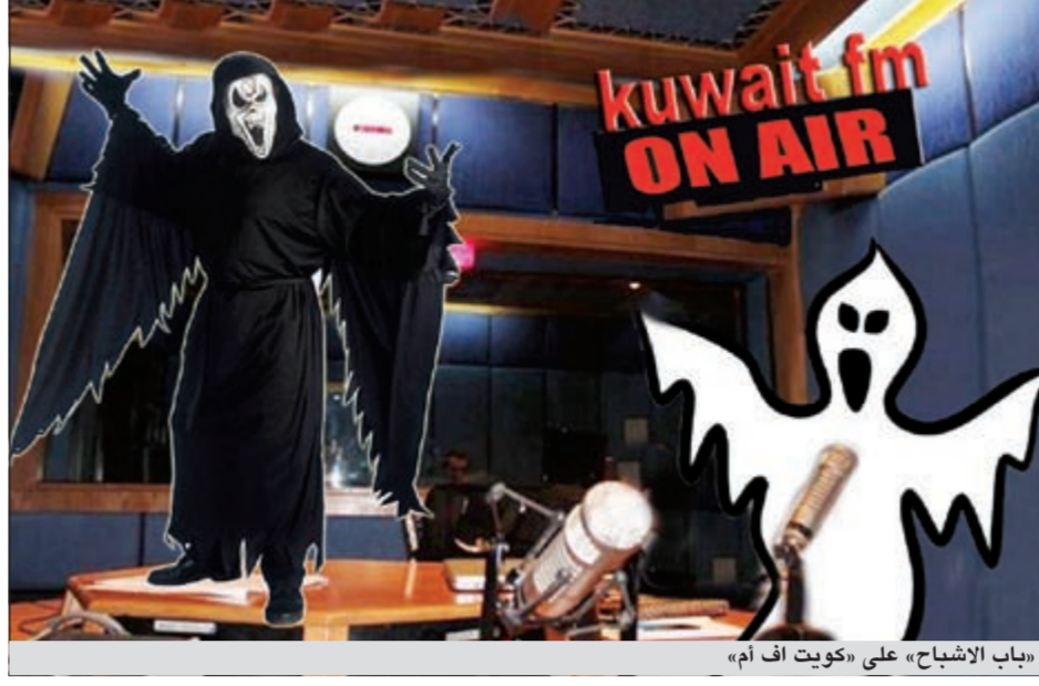
«باب الأشباح» على «كويت أف أم»