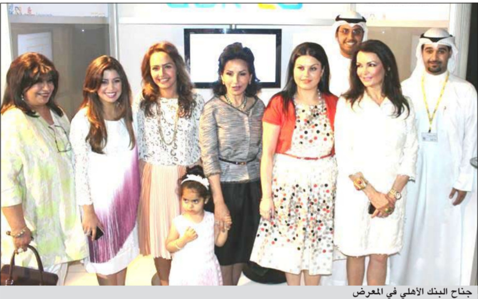
جنات البنك الأهلي في المعرض

أعلن البنك الأهلي الكويتي عن رعايته معرض «هلا رمضان اكسبو»، والذي يقام تحت رعاية الشيخة فريال الدعيج الصباح في مجمع 360 مول في الفترة من 22 إلى 25 أبريل الجاري، حيث سيستكون البنك متواجداً في جناحه الخاص بالمعرض لتقديم خدماته المصرفية للعملاء والزوار طوال فترة المعرض. وبهذه المناسبة صرحت مديرة العلاقات العامة سحر الزريان قائلة: «تأتي رعاية البنك المعرض هلا رمضان