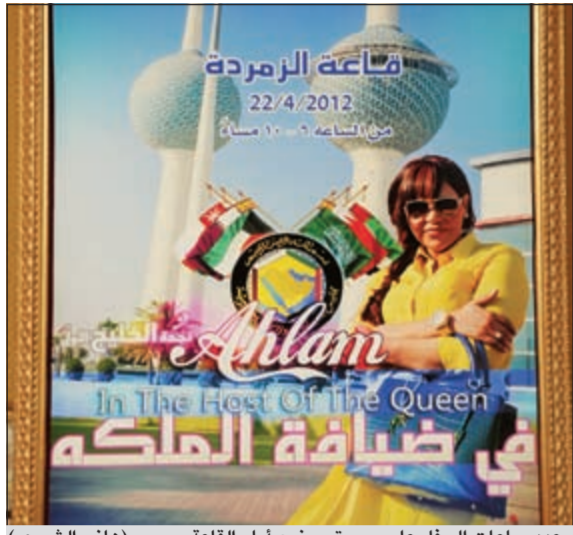
عدد ساعات الحفل على بوستر وضع أمام القاعة (هاني الشمري)