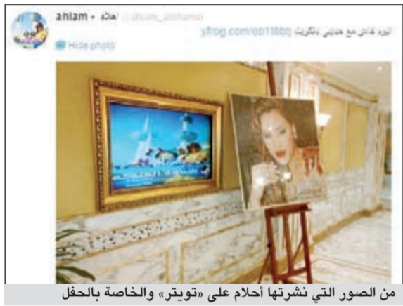
من الصور التي نشرتها أحلام على «تويتر»، والخاصة بالحفل