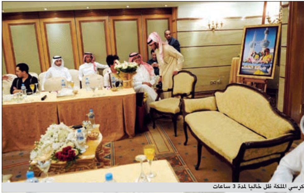
كرسي الملكة ظل خاليا لمدة 3 ساعات