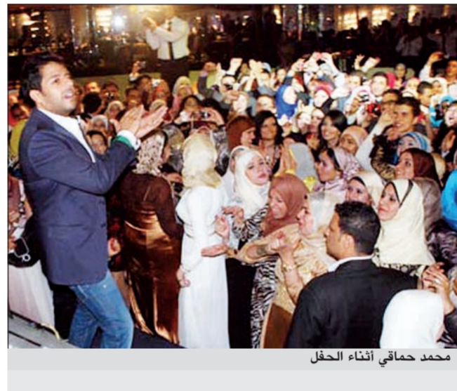
محمد حمافي أثناء الحفل

قدم النجم الشاب محمد حمافي حفلة تخرج كلية الصيدلة في جامعة القاهرة وسط حضور أكثر من 500 طالب، وبذلك، عاد حمافي إلى أحياء الحفلات بعد غياب عامين. وللأفان، بحسب موقع «أنا زهرة»، أن الحفل شهد حضور عدد كبير من الفنانيات المحجبات، وهو أكثر ما لفت الأنظار في هذه المناسبة التي أقيمت داخل فندق «فيرمونت» في القاهرة. كما استقبل حمافي المطرب الشاب كريم محسن الذي حل ضيف شرف على المسرح وشارك حمافي بعض أغنياته. وبدأ حمافي فقرته بأغنية «أم الدنيا» التي ردها أكثر من مرة بناء على طلب الحضور، كما قدم مجموعة كبيرة من اغنيات اليوم الأخير «حاجة مش طبيعية»، وسط صيحات وهتافات الطلاب.