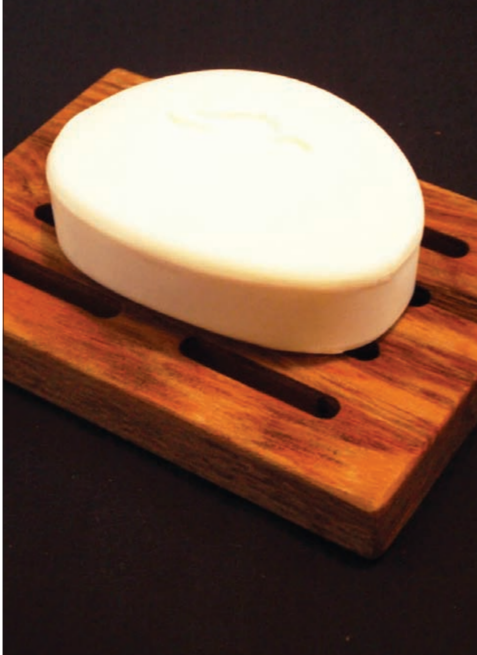
الصابون مواد حافظة تسبب حساسية بالعين