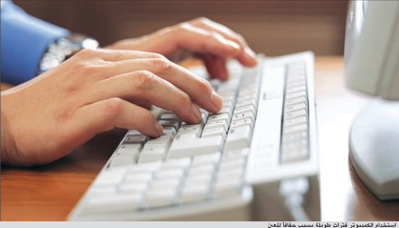
استخدام الكمبيوتر فترات طويلة يسبب جفافاً للعين

● خلق الله العين لكي نستخدمها ولكن هناك أشخاصاً مدمنين على استخدام الكمبيوتر، والموبايلات والإيفونات والبلاك بيري وغيره وهؤلاء يشعرون بشد حول منطقة العين وآلام، لأن أعينهم مكيفة على أن ترى الأشياء عن قرب وهذا يجهد العين فيسبب جفافاً وإجهاداً وآلاماً، وأحياناً صداعاً فأنصح من يتطلب عمله الجلوس أمام الكمبيوتر فترات طويلة أن يأخذ وقتاً للراحة، ويحاول الابتعاد عن الجهاز كل ربع ساعة كان يقف أمام الشباك مثلاً، أو يستخدم القطرات المرطبة، وإذا كان من الصعب عليه مغادرة مكانه فعليه ارتداء نظارات خاصة بمستخدمي أجهزة الكمبيوتر ويتطلب الأمر إجراء فحص العين لربما كان لديك