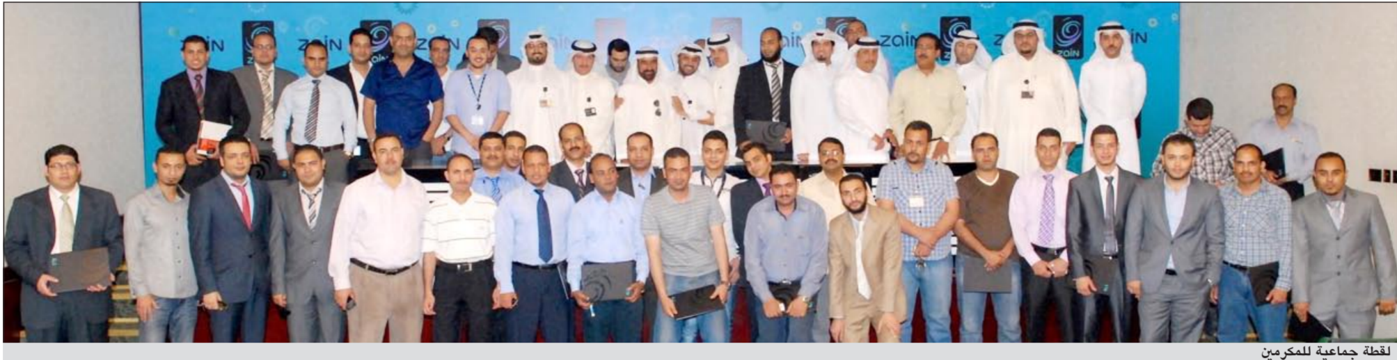
لقطة جماعية للمكرمين

احتفلت «زين» بموزعها المعتمدين الذين حققوا معدلات أداء متميزة عن فترة الربع الأخير من العام الماضي، حيث قامت الشركة بتكريم مجموعة من موظفي الموزعين لأدائهم العالي في الالتزام بمعايير الجودة وضبط كفاءة العمل مع قاعدة عملائها. وكرمت الشركة في بيان صحفي أن هذه الاحتفالية والتي أقيمتها في مقرها الرئيسي جاءت بغرض تشجيع وتحفيز موظفي موزعها على أداء أفضل ومواصلة العمل وفق خطط العمل المتفق عليها، مبيّنة أن هذا التكريم الربع السنوي يؤكد أهمية الدور الكبير الذي يلعبه الموزعون في تحقيق أهدافها وخططها التسويقية.