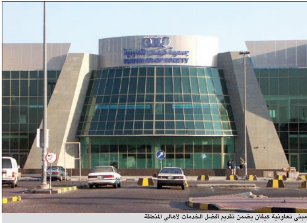
مبنى تعاونية كيفان يضمن تقديم أفضل الخدمات لأهالي المنطقة