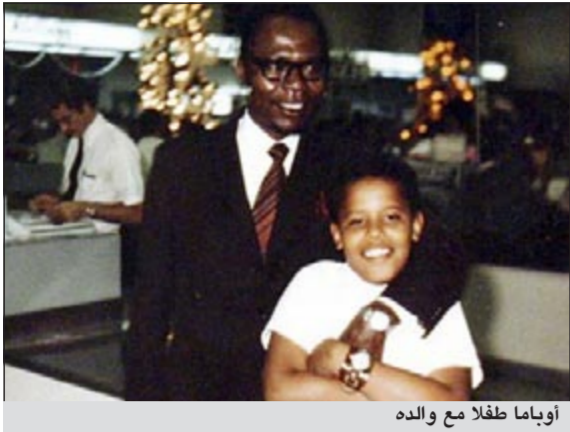
أوباما طلاع مع والده

إيلاف: ربما كان ببارك حسين أوباما الأبرز بين صناع التاريخ الأميركي والعالمي لكونه أول أسود يجلس في المكتب البيضاوي في البيت الأبيض. لكن هذه الحقيقة كانت وستظل كابوسا يجثم على صدور قطاعات واسعة في بلاد تعتبر موطن العبودية السوداء ولا تزال - بحكم الأمر الواقع - تعاني التمييز المدني السافر على أساس اللون والعرق. من هذا المنطلق، على الأرجح، ظل أوباما طوال سنوات حكمه الثلاث حتى الآن هدفا لكل ما من شأنه التشكيك في مقدرته على إدارة أكبر قوة اقتصادية وعسكرية وتكنولوجية في العالم. وضمن ما قيل في هذا الشأن إنه «ليس وطنيا مواليا لأميركا بما يكفي»، وبلغ هذا الأمر حدا أجبر معه أوباما في العام الماضي على نشر شهادة ميلاده من أجل إسكات أولئك الذين يقولون إنه لم يولد على الأراضي الأميركية (وتاليا لا يحق له بالمنصب الأعلى بموجب الدستور). وكان التاريخ بعيد نفسه... فقد طُفح على الصحافة الأميركية والبريطانية الإلكترونية مساء الخميس أن مخاوف مماثلة نشأت بشأن والده الكيني، ببارك حسين أوباما الأب. فقد طالته - مع آخرين - الشكوك الأميركية إزاء أنه معاد للولايات المتحدة وللبيض عموما لدى هجرته إلى البلاد في العام 1959.