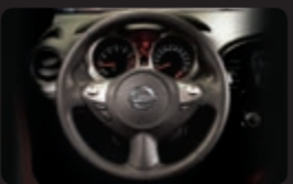
مفاتيح مشغلة على اللود للتحكم الآلي بالسرعة والنظام السمعي والهاتف