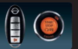
زر تشغيل المحرك ومفتاح نيسان الذكي