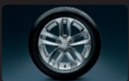
عجلات رياضية من الألومنيوم قياس 17 إنش