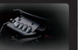
محرك سعة 1.6 لتر، 4 سلندر بقوة 117 حصان (متوفر أيضاً محرك تيربو سعة 1.6 لتر، 4 سلندر بقوة 190 حصان)