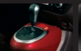
نقل حركة بثقبية التغير المستمر Xtronic CVT