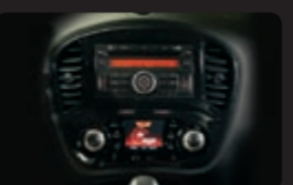
راديو مع مشغل أشرطة MP3 و CD مع AUX ذو 6 سماعات