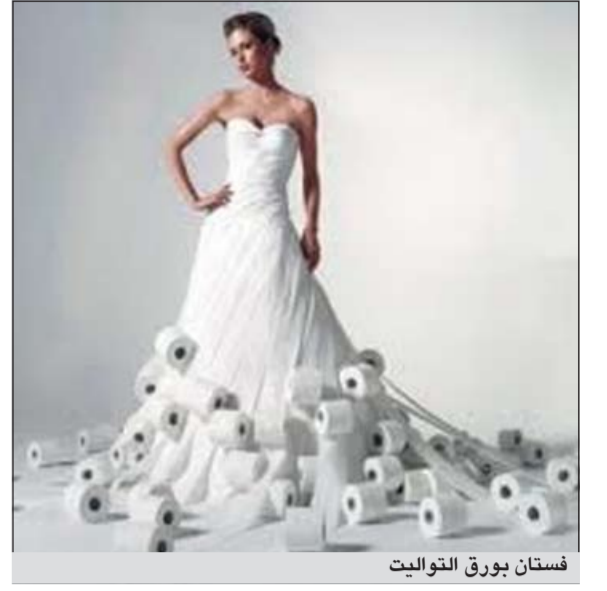
فستان بورق التواليت

بوكا راسون - يوبى.آي: قد يتمكن مصمم محظوظ من الفوز بمبلغ ألفي دولار مقابل تصميم فستان زفاف مصنوع كلياً من ورق المرحاض.