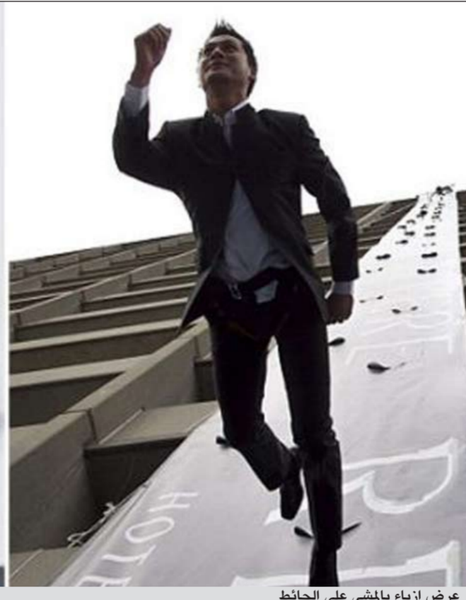
عرض أزياء بالمشي على الحائط

وقالت صحيفة الـ «ديلي ميل» البريطانية ساخرة: إنهم بهذه عارضو الأزياء من إحدى أشهر الصالات الرياضية للياقة البدنية في مدينة بوسطن، وارتدوا أزياء ربيع - صيف 2012، التي رسم خطوطها آثار الرعب في قلوب المتابعين في الشارع.