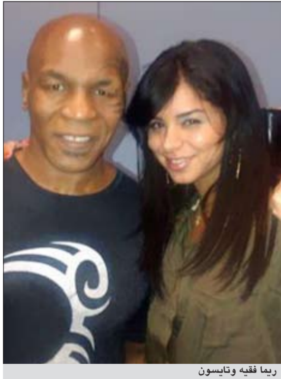
ريما فقيه وتايسون

إم.بي.سي: دعت ملكة جمال أميركا ذات الأصول اللبنانية ريمًا فقيه الملاكمة الشهيرة «مايك تايسون» للعودة مرة أخرى إلى حلبة الملاكمة، ونشرت على حسابها الخاص بـ «تويتر» صورة تجمعها خلال حفل نظمه اتحاد «WWE» للمصارعة، وقالت: «كم أتمنى أن أراه مرة أخرى على حلبة الملاكمة».