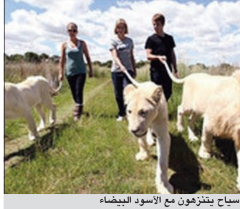
سياح يتنزهون مع الأسود البيضاء

محمية حيوانات برونيا التي تقع في جنوب أفريقيا قررت أن تتيح للسياح التزهر مع 3 أسود من النوع النادر. في الحقيقة يستطيع السياح السير وراء الأسود الثلاثة مسكين ذبولها، متوغلين في الغابة. وتعتبر الأسود الثلاثة (ذكر وأنثيان) من نوع نادر يتعرض للانقراض بسبب الصيد غير الشرعي. تتميز هذه الأسود بفرو أبيض مما يجعلها مختلفة عن بقية الأسود الأخرى، هذا الفرو كان يجذب الصيادين، فقد كانوا يقتلون هذه الأسود لفرانها، ولم يتبق منها في العالم سوى مائة أسد.