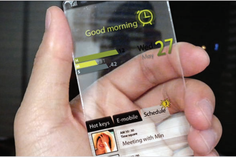
الهواتف قادرة على الرؤية عبر الجدران

سينول - أ.ف.ب: تعزز كوريا الجنوبية وضع حد للمتخصصين الذين يسترقون النظر لرؤية ما تخبئه تنانير الشبكات بواسطة تطبيق «الكاميرا الصامتة» على هواتفهم الخلوية، بحسب ما أعلنت الحكومة الأربعاء. وتجري حاليا محادثات بين السلطات وشركات صناعة الهواتف بهدف وضع حد لعادات التجسس على الملابس الداخلية في بلد ترتدي فيه غالبية الطالبات التنانير. وقال مسؤول في لجنة الاتصالات فضل عدم الكشف عن هويته لوكالة فرانس برس «أطلقنا منذ فترة وجيزة مناقشات مع شركات من قبيل «سامسونغ»، و«إل جي» و«غوجل» و«آبل» لمعرفة إذا كان من الممكن تقنيا تعطيل هذه التطبيقات».