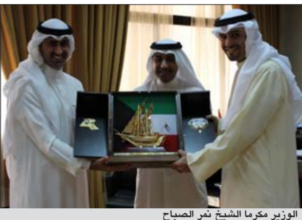
الوزير معرما الشيخ تفر الصباح

استقبل وزير التجارة والصناعة أنس الصالح أمس رئيس الفريق الفني المعني بمراجعة السياحة التجارية للشؤون التجارية للمكوث الوكيل المساعد لشؤون التجارة الخارجية الشيخ نمر فهد الصباح وأعضاء الفريق. وقدم الوزير والصالح الشكر لرئيس وأعضاء الفريق الفني على جهودهم المبدولة لهذا الفريق وحثهم على المزيد من العطاء.