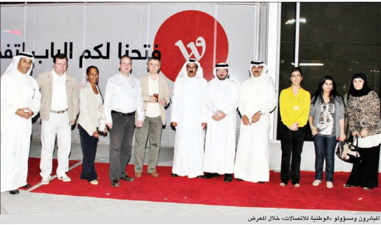
المبارون ومسؤولو «الوطنية للاتصالات» خلال المعرض