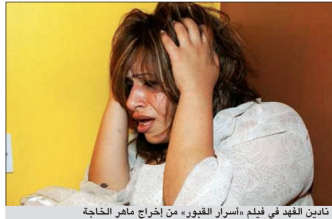
نادين الفهد في فيلم «أسرار القبور» من إخراج ماهر الخاجة

مثل شنو؟ ● مثل اغتصاب الفتيات من قبل أبائهن وتحرش الفتيات من