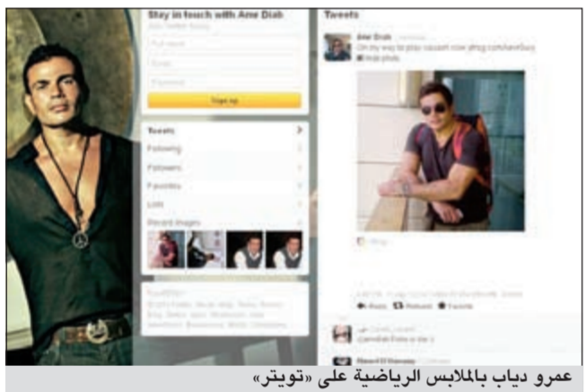
عمرو دياب بالملابس الرياضية على «تويتر»

أن يقدم مجموعة من أجمل أغنياته القديمة والحديثة، وأغنية جديدة يفاجئ بها جمهوره، كعادته في كل حفل. وأعلنت إدارة الموقع الرسمي للمنتج المصري عن منح 5 تذاكر مجانية لحضور الحفل عبر مسابقة يطرحها الموقع.