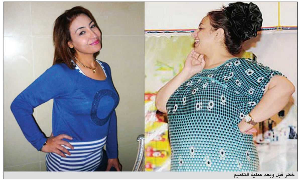
خطر قبل وبعد عملية التكميم