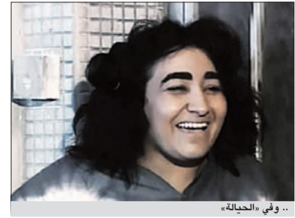
.. وفي «الحياة»

تمل منه وراح يخليك تاكل بين فترة واخرى لكن عملية التكميم تخلي المعدة تصغر ويسرعة تشبع.