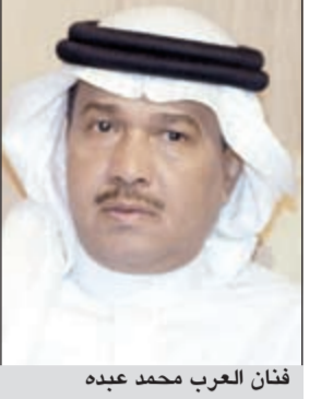
فنان العرب محمد عبده

لأنها كانت تحبه كثيراً. من جانب آخر، تالقت الفنانة اللبنانية نجوى كرم خلال ثاني حلقات الموسم الثاني «غات تالنت» بيسوار تصميمه يشبه إلى حد كبير شكل التئين الصيني، وترتدي نجوى كرم خلال حلقات البرنامج مجموعة متنوعة من الإكسسوارات والمجوهرات غالبيتها من مجموعة لوبوتان العالمية وكذلك زانوتي ولويس فويتون.