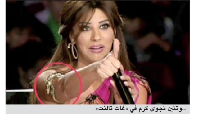
..وتئين نجوى كرم في «غات تالنت»

كما ذكر خالد ان أحلام دفعت 30 مليون ريال لبطل الرالي القطري مبارك الهاجري للزواج منها، وكتب خالد أن أحلام تسببت بطلاق الفنان محمد عبده من زوجته الأولى،