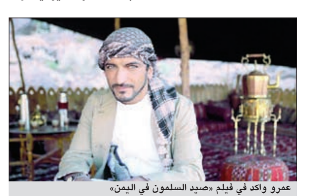
عمرو واكد في فيلم «صيد السلمون في اليمن»

احتل فيلم «صيد السلمون في اليمن» الذي يشارك في بطولته النجم المصري عمرو واكد امام ابوان ماكجريجور وايملي بلون، المركز الثامن في شبكات التذاكر الأميركية. وقد