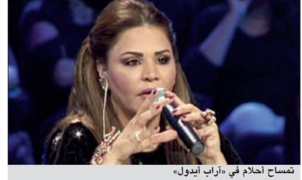
تمساح أحلام في «آراب آيدول»