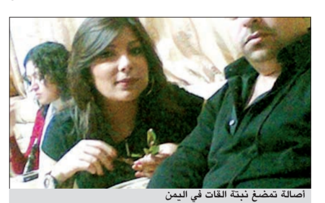
أصالة تمضغ نبتة القات في اليمن

انتشرت منذ أيام صورة للفنانة أصالة تمضغ نبتة القات في اليمن، فأثارت زوبعة من الجدل، ونشرت الصورة في موقع «نبا» الذي أكد أنها فعلاً الفنانة السورية تمضغ