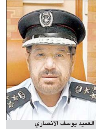
العميد يوسف الأنصاري