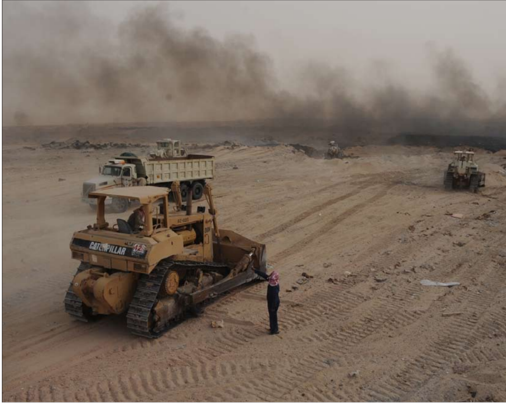
الجرافات تسابق الزمن لاتمام عملية ردم الإطارات (هاني الشمري)