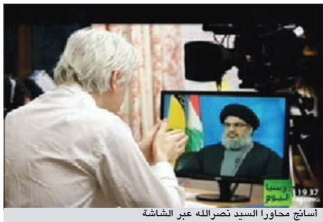
أسانج محاوراً السيد نصرالله عبر الشاشة

داخل سورية، وبعضها دول عربية وغير عربية». في سياق آخر، أكد السيد نصرالله أن «دولة إسرائيل هي دولة غير قانونية، وقامت على أساس احتلال أراضي الآخرين»، مشيراً إلى أن «الحل الوحيد هو قيام دولة واحدة على أرض فلسطين يعيش فيها المسلمون واليهود والمسيحيون بسلام»، كاشفاً عن أنه «في عام 1993 حصل هناك تفاهم غير مباشر بين المقاومة اللبنانية وإسرائيل بتجنّب قصف المدنيين».