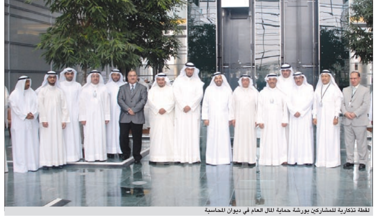
لقطة تذكارية للمشاركين بورشة حماية المال العام في ديوان المحاسبة