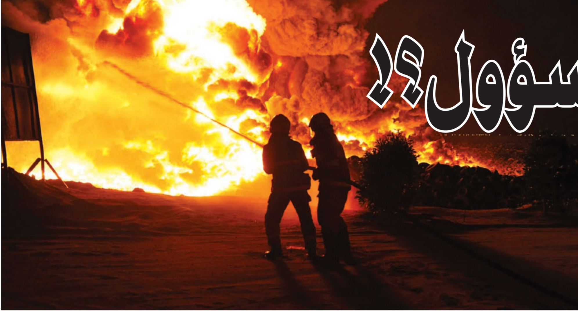
رجال الإطفاء يكافحون النيران المشتعلة في جبل إطارات «رحية» والتي خلفت أكبر حريق منذ اشتعال آبار النفط إبان الاحتلال العراقي الغاشم (سعود سالم)

مريم بندي - أمير زكي - دارين العلي - محمد الخالدي - حنان عبد المعهود - فرج ناصر فريق العمل: حمد العنزي - عادل الشنان - طاني الظفيري - محمد الجلاد - عبد الكريم العبدالله احمد يوسف - عاطف رمضان - عائشة الجلاد - (تصوير: فاني الشمري - سعود سالم)