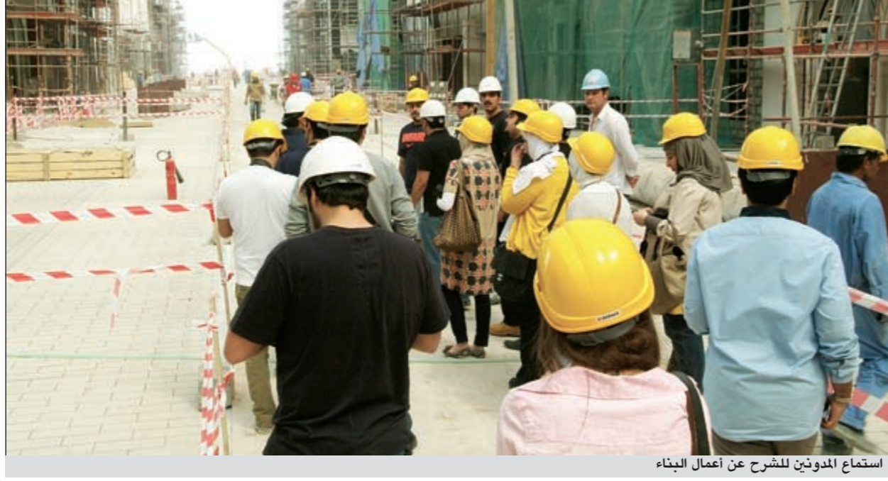
استماع المدونين للشرح عن أعمال البناء