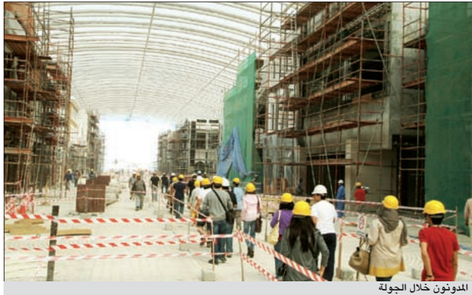
المدونون خلال الجولة