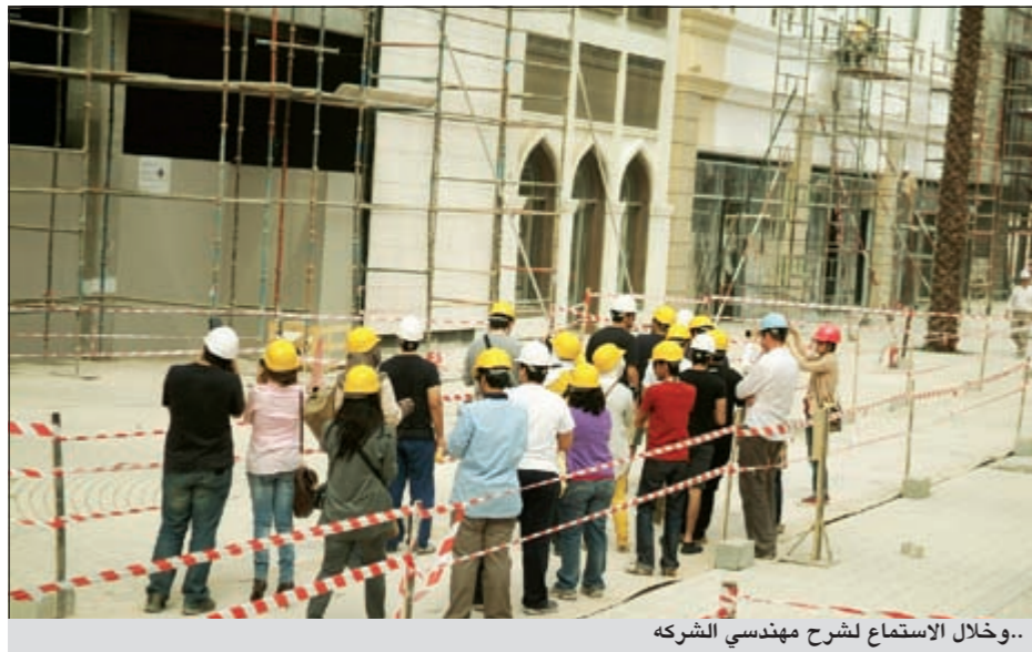
..وخلال الاستماع لشرح مهندسي الشركة