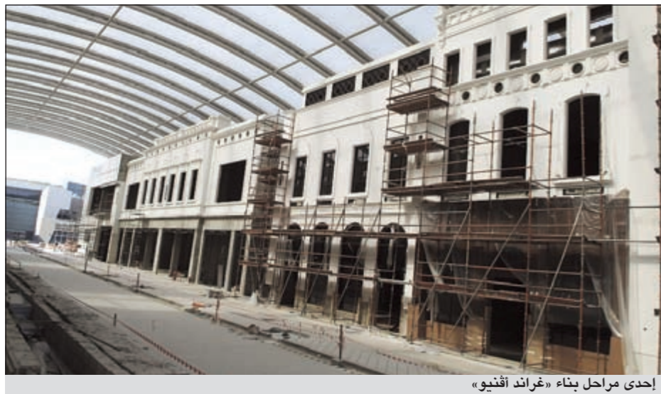
إحدى مراحل بناء «غراندي أقيويو»

استضاف الأقنيوز عددا من المدونين في موقع التوسعة الجديدة التي من المقرر افتتاحها في سبتمبر القادم، للاطلاع على مراحل تطور المشروع وما يتميز به من مزيج متنوع من المناطق المختلفة والعلامات التجارية المتنوعة.