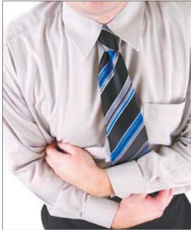
الأم الجلطة قد تصل إلى المعدة