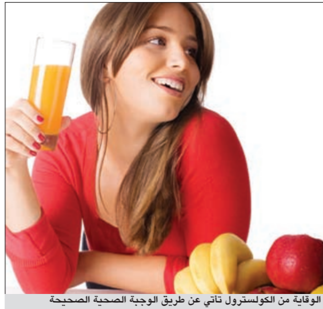
الوقاية من الكوليسترول تأتي عن طريق الوجبة الصحية الصحيحة