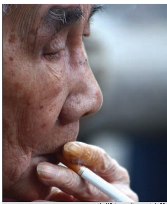
التدخين يسبب إلى صحة الإنسان

ومن الأعراض الأخرى التي رصدت فيها الذبحة الصدرية أيضاً ظهور ألم في الذراع اليسرى، تميل إلى وحز في أصبع اليد اليسرى، ألم في الرقبة، وأوجاع في الفك، وقد أشارت دراسة من الأوروغواي إلى أن أعراض أوجاع الفك أو أوجاع الرأس فقط رصدت لدى 6% من الناس المصابين بحالة الذبحة الصدرية. إن كانت أوجاع الفك دائمة وتستمر لفترة طويلة، أو أنها تزداد سوءاً عند الاستيقاظ في الصباح، فإنه من المحتمل أن يكون الشخص من الذين يطحنون أسنانهم، أما إن كانت الأوجاع متناوبة، أي تأتي وتذهب، بالتزامن مع النشاط البدني أو التوتر، فإنها يمكن أن تكون ناجمة عن ضيق في الشرايين التاجية.