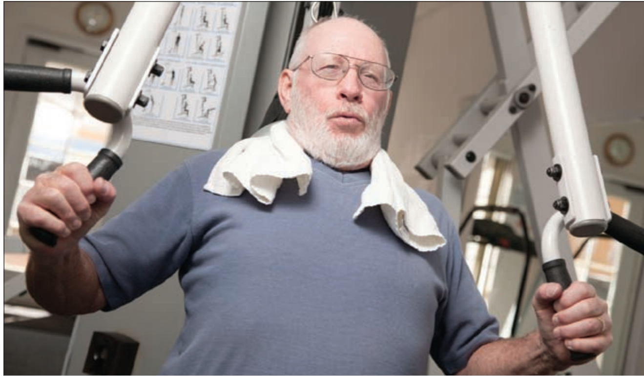
يجب الحفاظ على الوزن للحفاظ على قلب قوي

ان أهم أعراض مرض القلب هي آلام في الصدر، وصعوبة التنفس وتورم الكاحلين والخفقان، ولكن يجب تحديد طبيعة ألم الصدر الذي ينشأ عن مرض القلب، وكذلك مقدار ضيق التنفس الذي يعتبر طبيعيا ومتى يكون تورم الكاحل طبيعيا وما هي طبيعة الخفقان الذي يحدث كنتيجة لمرض في القلب بالنسبة لأم الصدر فتستمد عضلة القلب تغذيتها الدموية واحتياجاتها من الأكسجين عن طريق الشرايين التاجية، وهذه الشرايين قد تضيق أو تسد فيؤدي ذلك إلى حرمان جزء من عضلة القلب الذي يغذيه الشريان المصاب من الحصول على التغذية الدموية الكافية، عندئذ يشعر المريض بألم في صدره.