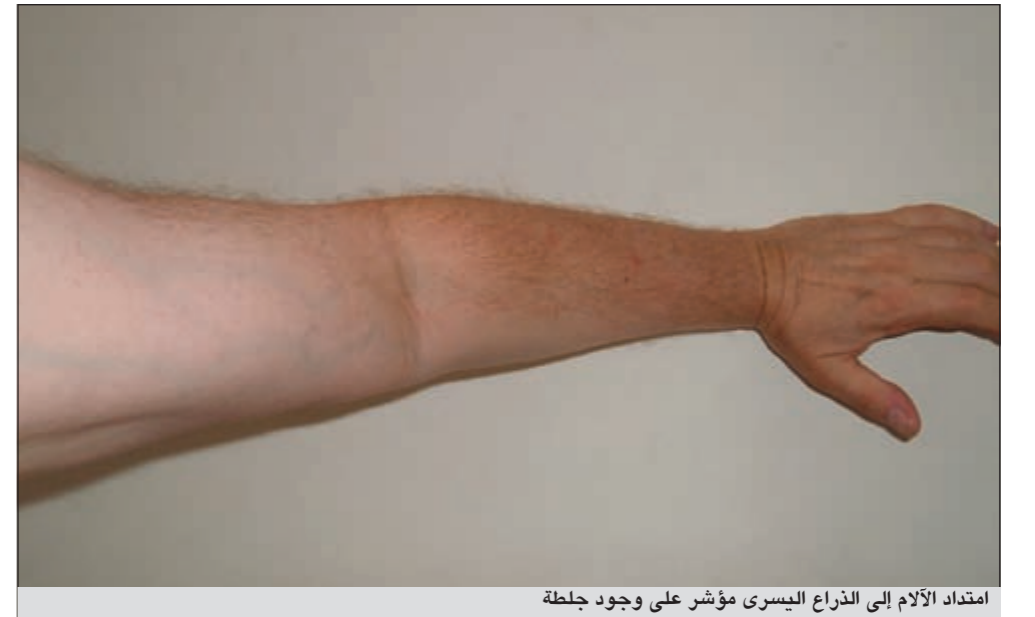
امتداد الألم إلى الذراع اليسرى مؤشر على وجود جلطة

بالصدر فربما يكون جلطة أو ألم بالعضلات، أو بالأضلاع أو التهاب رئة حادا أو ارتجاعا في المريء أو تسلخا في الشريان الأبهر أو رجا صدرية فهذه مجموعة تشخيص تفريقية ومطلوب منى استعمال المعطيات السريرية والمخبرية والتخطيطية وإشعاعية حتى أستطيع أن أجعل أولوياتي بالتشخيص وبناء على المنطق أجري للمريض تخطيطاً أو تحليلاً لإنزيمات القلب أو أشعة للصدر، أو سوناراً للقلب وربما أجري تصويراً مقطوعياً للقلب أو قسطرة أو أدخله إلى المستشفى للمراقبة وهكذا.