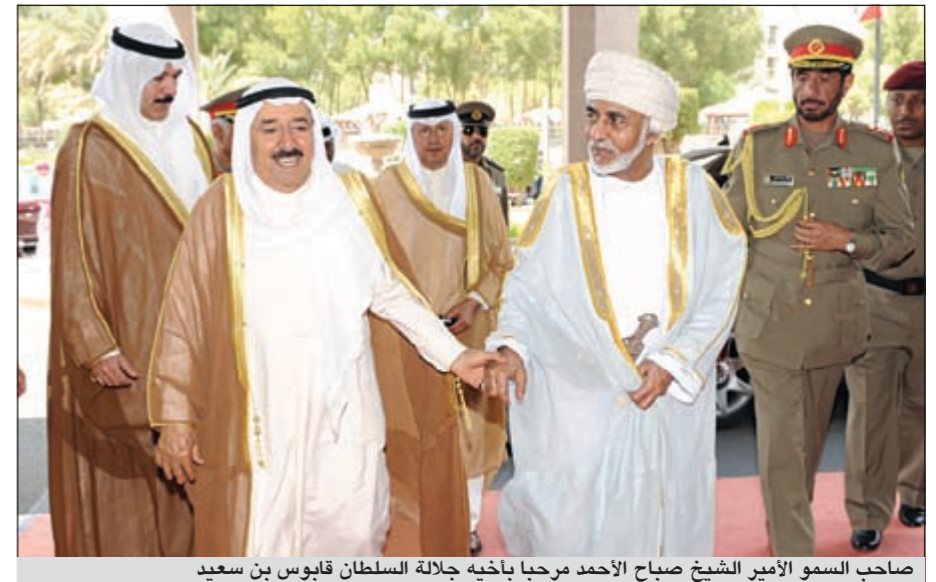
صاحب السمو الأمير الشيخ صباح الأحمد مرحباً بأخيه جلالة السلطان قابوس بن سعيد

وأضافت المصادر ان ديوان الخدمة المدنية بصدد إصدار بيان يوضح للموظفين قيمة الزيادات والبدلات لجميع الدرجات الوظيفية،