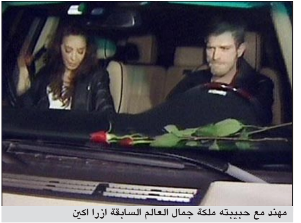
مهند مع حبيبته ملكة جمال العالم السابقة أيزرا اكين

بعد قرار الممثل التركي كيفانتش تاتليتوغ المعروف في العالم العربي باسم مهند الزواج من حبيبته ملكة جمال العالم السابقة أيزرا اكين بعد علاقة منقطعة جمعتهما، التقطت عدسات الجابارتزي صورا للثنائي يخرجان من أحد المطاعم في تركيا حيث احتشد المصورون والصحافة عند خروجهما من المطعم.