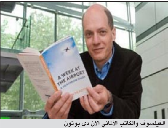
الفيلسوف والكاتب الألماني ألان دي بوتون

برلين- د.ب.أ: اعتبر الفيلسوف والكاتب الألماني ألان دي بوتون الكتاب، بما فيه هو نفسه، مرضى بمرضية الذات. وقال الفيلسوف (42 عاما) في لقاء مع موقع صحفية «برلينر تاسيتونج» الألمانية على شبكة الإنترنت «حين أستمع إلى الشباب يقولون إن بوههم أن يصيروا كتابا، فأنتي أشعر بالرتاء لحالهم شيئا ما». وأضاف دي بوتون وهو ألماني من أصل سويسري أن كثيرا من الكتاب يرتبطون إلى حد كبير بذواتهم. مبينا أنه لا يستتني نفسه من هذه الصفة. وقال دي بوتون: «أعتقد أنني لدي شعور بأن أحدا لا يلاحظ وجودي، لذلك فعلى أن أستلفت الانتباه». وأرى أن من النرجسية بدرجة ما أن تكون كتابا، وهذا شعور مرضي بصورة ما». وأشهر دي بوتون بكتبه الفلسفية ذات الطابع الاجتماعي مثل «فن السفر» و«حالة الخوف»، كما ظهر له مؤخرا كتاب بالألمانية هو «السعادة والشقاء في العمل».