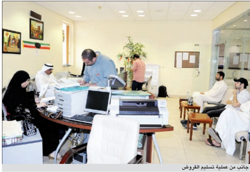
إحدى موظفات الفرع الرئيسي في انتظار المراجعين (قاسم باشا)