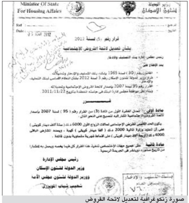
صورة زنگرافية لتعديل لائحة القروض

مفتوحة لاستقبال الطلبات حيث انه ليست هناك فترة محددة لاغلاق باب الطلبات. وقال ان قرض الزواج والبالغ 6 آلاف دينار سيكون منه 2000 دينار منحة والـ 4 آلاف الباقية ستكون قرضاً من دون فائدة ويقسط شهري ببلغ