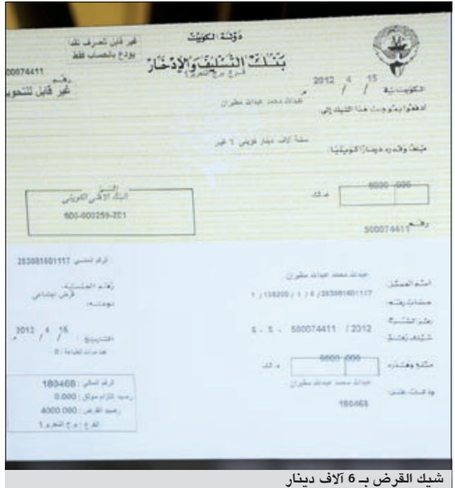
شيك القرض بـ 6 آلاف دينار