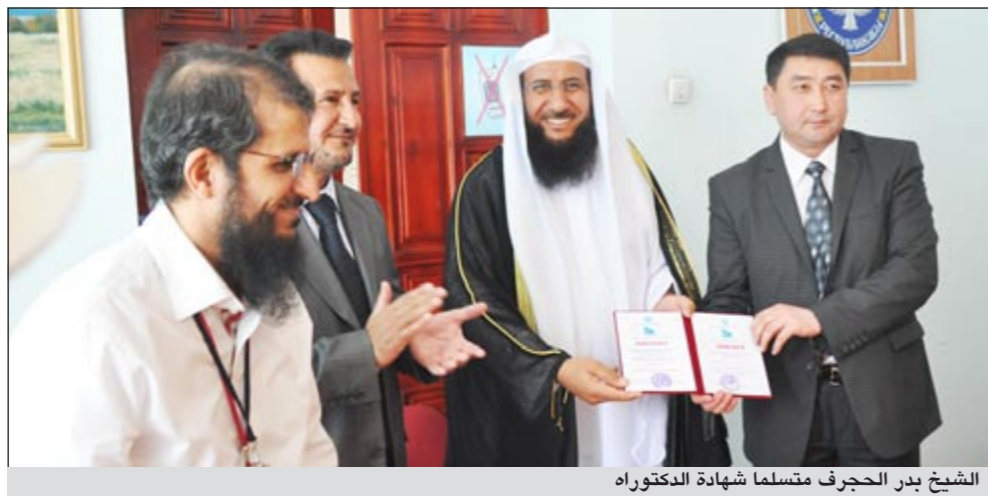
الشيخ بدر الحجرف متسلما شهادة الدكتوراه

وتم الاعلان عن حصول الشيخ بدر الحجرف على درجة الدكتوراه خلال مراسم احتفال اقيم بهذه المناسبة في