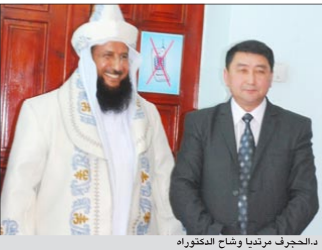
د.الحجرف مرتديا وشاح الدكتوراه

وتم الاعلان عن حصول الشيخ بدر الحجرف على درجة الدكتوراه خلال مراسم احتفال اقيم بهذه المناسبة في