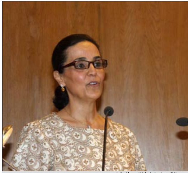
.. وتلقي كلمتها خلال حفل التكريم