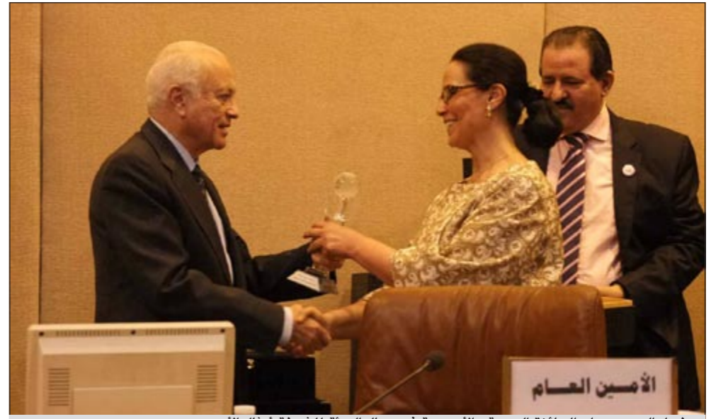
د.نبيل العربي يسلم الجائزة العربية - الأوروبية في مجال البيئة للشيخة أمثال الأحمد

وتشجيع جهودها في الارتقاء بالمجتمع لافتة الى انطلاق مؤتمر القيادات النسائية العربية قريبا في الكويت لاستقطاب القيادات النسائية الناشطة في مجال البيئة خلال المرحلة المقبلة والإسهام في تحقيق التنمية المستدامة.