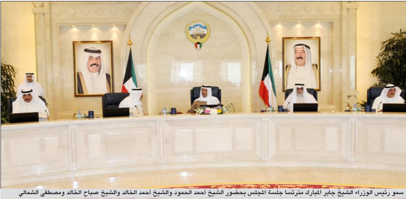
سمو رئيس الوزراء الشيخ جابر المبارك مترسلا جلسة المجلس بحضور الشيخ أحمد الحمود والشيخ أحمد الخالد والشيخ صباح الخالد ومصطفى الشمالي

تتم استعراض المجلس توصيات لجنة الخدمات العامة الخاصة بمقتراح القضاء على مشاكل المواطنين في مناطق السكن الخاص والنموذجي وقرر المجلس الموافقة على تفعيل المرسوم بالقانون رقم 125 لسنة 1992 والقرار الإداري رقم 11/1963 بشأن مشروع مرسوم بالموافقة على العائلات في بعض المناطق السكنية بما يؤدي الى تحقيق الإخلاء الإداري للسكن المخالف بصورة مباشرة دون الحاجة للعرض على المحاكم وذلك للمرحلة الأولى وتكليف ادارة الفتوى والتشريع بدراسة تعديل المرسوم بالقانون والقرار الإداري المشار إليهما بما يحقق الأهداف المرجوة من العمل به للمرحلة المستقبلية. كما استعرض المجلس توصية لجنة الشؤون القانونية مشروع قانون بتعديل نص المادة 63 من القانون رقم 23 لسنة 1968 بشأن نظام قوة الشرطة ومشروع قانون بالموافقة على اتفاقية بين حكومة الكويت وحكومة جمهورية جيبوتي للتشجيع والحماية