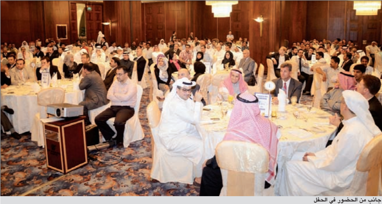
جانب من الحضور في الحفل