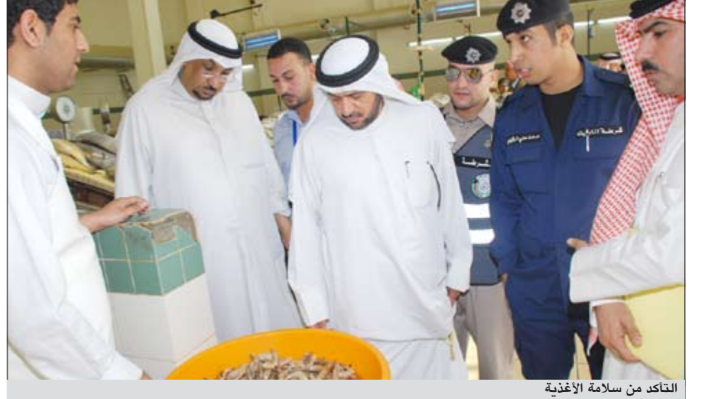
التأكد من سلامة الأغذية

الحملة التفتيشية التي شنتها بلدية محافظة الجهراء بالتعاون مع إدارة العلاقات العامة بالبلدية بمساعدة أمنية من مديرية الأمن بمحافظة الجهراء على سوق الأسماك وعدد من الأسواق والمحلات الغذائية بالمنطقة الصناعية بالجهراء وأسفرت عن تحرير 12 مخالفة وتوجيه 6 إنذارات لتنفيذ الاشتراطات وإتلاف 11 كيلو غراماً من الأسماك واللحوم غير الصالحة للاستهلاك الأدمي.