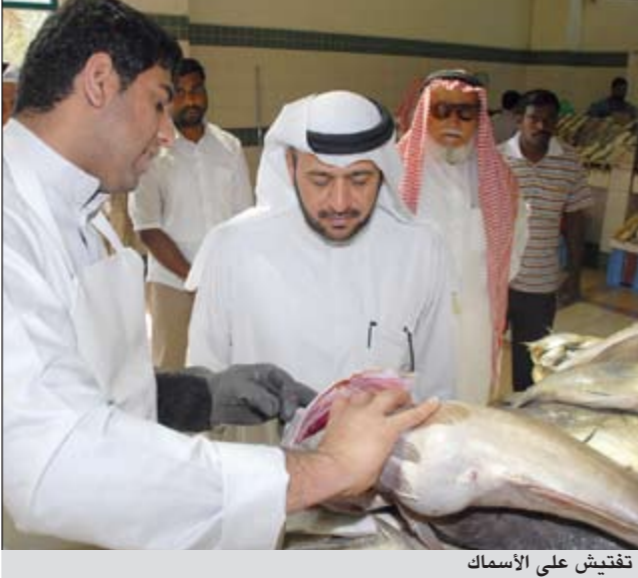
تفتيش على الأسماك

وتساءل الصويان لماذا تم تحديد 4 أشخاص وذكرتهم الهيئة باسمائهم في البيان وتركت بقية المتحدثين في المؤتمر الصحفي، مؤكداً أن غلاء أسعار السمك هو مشكلة مفتعلة من قبل الثروة السمكية، وهناك بعض