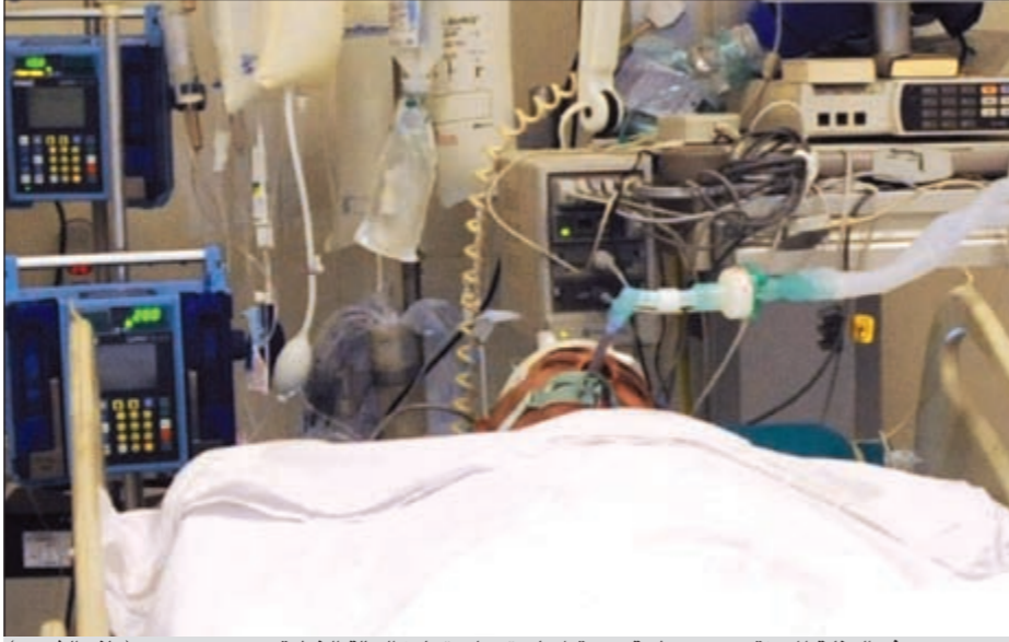
سمير سعيد في العناية المركزة.. وجهود طبية كبيرة لمساعدته على تجاوز الحالة الخطرة (هاني الشمري)

يصل السلطان قابوس بن سعيد سلطان عمان إلى البلاد غداً (الاثنين) في زيارة خاصة تستغرق ثلاثة أيام تلبية لدعوة كريمة من صاحب السمو الأمير الشيخ صباح الأحمد. وتأتي هذه الزيارة دعماً للتعاون الثنائي المثمر بين البلدين في إطار ما يربطهما من علاقات أخوية متينة. ويرافق السلطان عمان وفد رسمي رفيع المستوى يضم وزراء الخارجية والدفاع والمالية ومستشار شؤون التخطيط الاقتصادي. وتأتي زيارة السلطان قابوس إلى الكويت بعد زيارته إلى دولة الإمارات العربية المتحدة الشقيقة وسيقوم بعدها بزيارة إلى عدد من الدول الأوروبية.