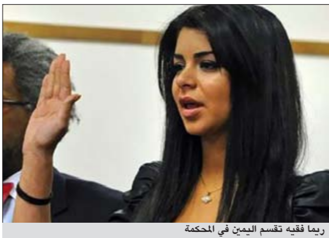
ريما فقيه تقسم البين في المحكمة

وفازت فقيه بلقب ملكة جمال اميركا لعام 2010، لتصبح بذلك أول ملكة جمال من اصول عربية فقيه عقوبة السجن لمدة 93