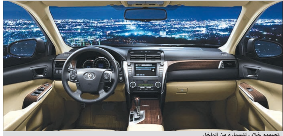
تصميم خلاب للسيارة من الداخل

استراتيجيتنا تطورا نحو الأمام وعلى ثقة في السوق الكويتي ومستمرين في تنفيذ خططنا التوسعية دون أي تعديلات وبشكل ثقة لبناء أكبر عدد من المراكز والمرافق لتويوتا وكرزس وقائمون على إنشاء مشاريع أيضا متكاملة في الأحمدى والفحيجيل وأبوظفيرة بتوفير كافة الخدمات البيعية والخدمات المساندة لما بعد البيع بتوفير معارض جديدة للسيارات ومعارض للسيارات المستعملة المعتمدة وكراجات بكافة أنواع الخدمات فيها ومراكز لقطع الغيار وكان آخرها بداية هذا الأسبوع بتدشين مركز لكرزس الأحمدى الذي يعد انطلاقة ذات