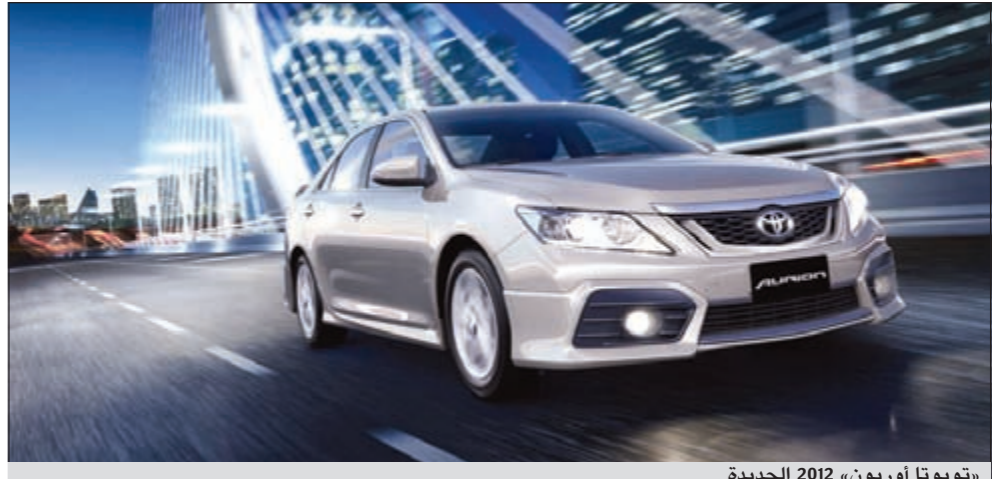
«تويوتا أوريون» 2012 الجديدة

● محرك 3500 سي سي بقوة 268 حصانا مع نظام VT-i المزودج (توقيت الكتروني متغير ونكي للصمامات). ● أقل الحركة أوتوماتيكي التحكم بـ 6 سرعات ونظام التشغيل الذكي ونظام دخول السيارة بدون مفتاح. ● مشغل أسطوانات مزود بمشغل MP3 + USB + AUX + بلوتوث - نظام ملاحه GPS - كاميرا خلفية. ● نظام فرامل غير قابلة للانغلاق (ABS) ومنظم استقرار السيارة على الطريق (VSC). ● مقاعد من الجلد تعمل كهربائيا ومقعد السائق مزود بمفتاحين للذاكرة ووسائد هوائية للمقاعد الأمامية والخلفية ومكيف هواء منفصل عالي الجودة.