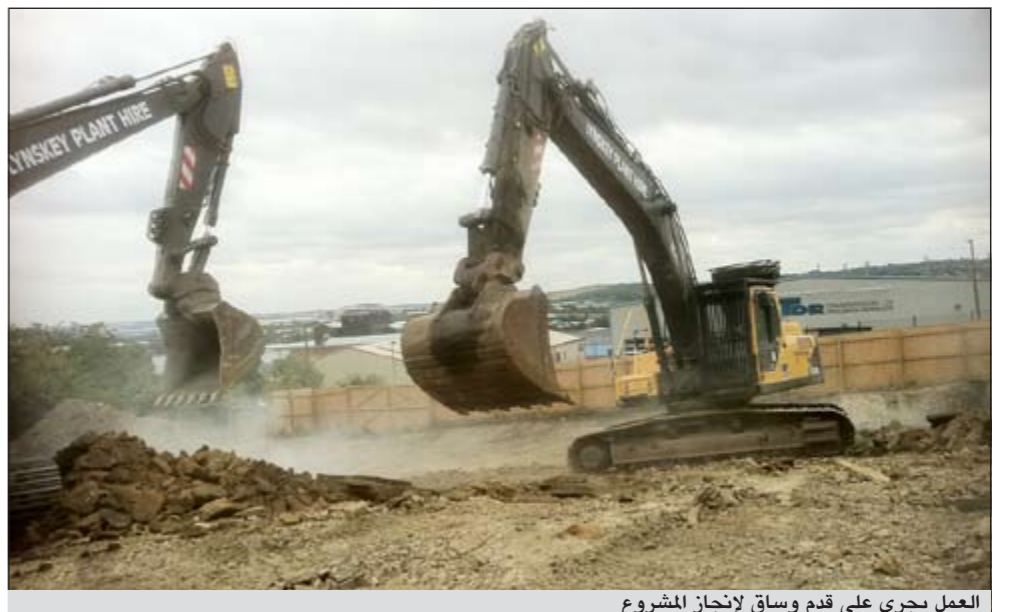
العمل يجري على قدم وساق لإنجاز المشروع