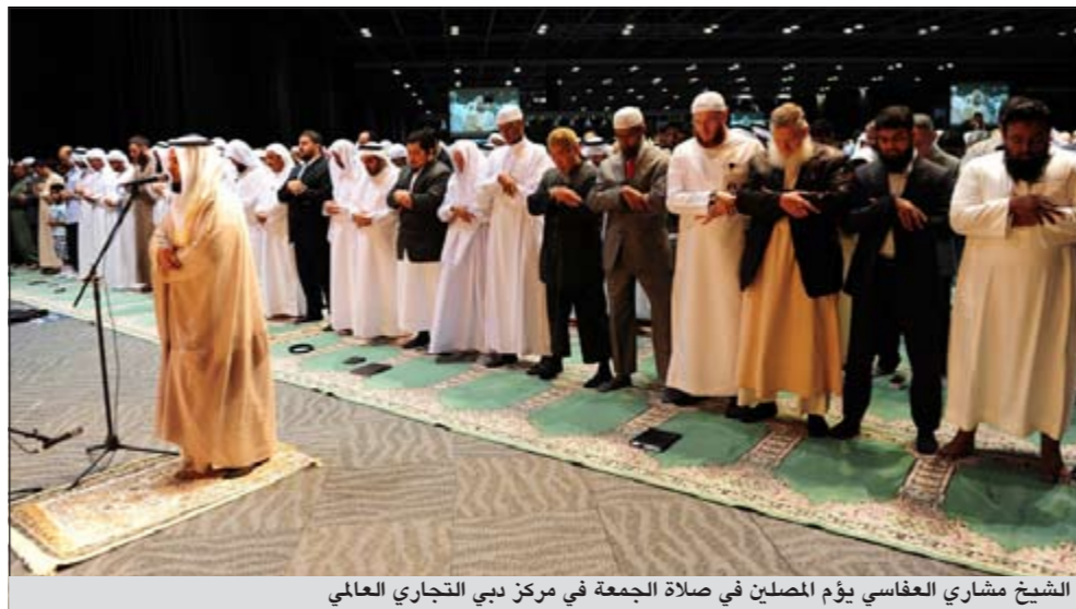
الشيخ مشاري العفاسي يوم المصلين في صلاة الجمعة في مركز دبي التجاري العالمي

ويشار الى أن خطيب وإمام المسجد الحرام الشيخ عبدالرحمن السديس يحل أيضا ضيف شرف على المؤتمر. واستهل المؤتمر أعماله بقراءة عطرة من آيات الذكر الحكيم للشيخ مشاري العفاسي ثم كلمة افتتاحية للجهة المنظمة للمؤتمر ألقاها رئيس مجلس أمناء جائزة محمد بن راشد آل مكتوم للسلام د.محمد بن الشيخ أحمد الشيباني أكد خلالها أن الإمارات غدت وأحدة من دول العالم الإسلامي التي تشهد نهضة إسلامية حقيقية واقعا ملموسا. وأعلى الشيخ يوسف استس بعد ذلك منصة المؤتمر ليلقي رسالة المؤتمر حيث أبرز فيها صميم وروح رسالة الإسلام المتمثلة في السلام، مستشهدا بعدد من الآيات القرآنية الكريمة والأحاديث الشريفة، مشددا على أن مقاصد الشريعة استهدفت في جملتها الحفاظ على سلام الفرد الداخلي والسلام بين أفراد المجتمع جميعا.