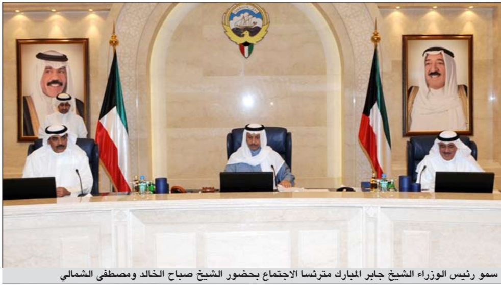
سمو رئيس الوزراء الشيخ جابر المبارك مترئسا الاجتماع بحضور الشيخ صباح الخالد ومصطفى الشمالي

ترأس سمو رئيس مجلس الوزراء الشيخ جابر المبارك في قصر السيف أمس الاجتماع الثاني عشر للجنة الوزارية لمتابعة تنفيذ الخطة التنموية السنوية والوقوف على تفاصيل خطوات اجاز مشروعاتها والتأخير الذي شابهها وأسباب التأخر والمعوقات وخطة حل هذه المعوقات. وقال وزير الأشغال ووزير الدولة لشؤون التخطيط والتنمية د.فاضل صفر ان الاجتماع قد خصص لمناقشة مشروع مدينة صباح السالم الجامعية في الشداية حيث استمعت اللجنة الى عرض مفصل عن المشروع قدمه كل من د.عبدالمطيف البدر مدير جامعة الكويت ود.مالك غلوم نائب المدير لشؤون التخطيط ود.رنا الفارس مديرة البرنامج الانشائي من حيث سير العمل فيه ونسب الإنجاز في الخطوات التنفيذية في الحزم الجامعية الخاصة مثل حزمة البنية الأساسية والحزم الخاصة بإنشاء الكليات والحزمة الخاصة بتصميم وتنفيذ المباني المساندة. ويعد مناقشة تفاصيل المعوقات شدد سمو رئيس مجلس الوزراء على أهمية الإسراع في تنفيذ المشروع دون تأخير وحث كل الجهات الحكومية على تسريع انجاز المشروع باعتباره أحد المشروعات الكبرى في الخطة السنوية.