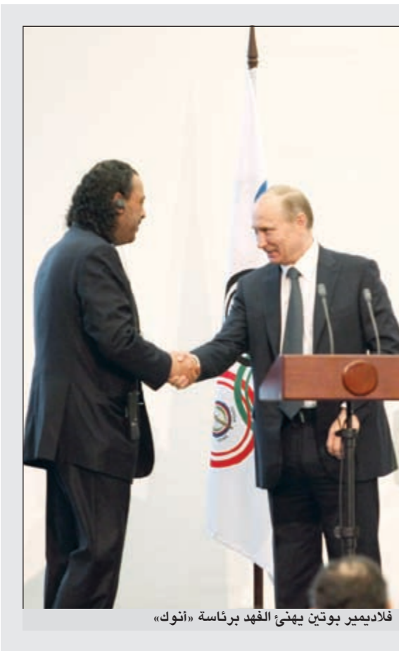
فلاديمير بوتين يهنئ الفهد برئاسة «أنوك»