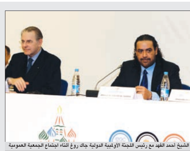
الشيخ أحمد الفهد مع رئيس اللجنة الأولمبية الدولية جاك روج أثناء اجتماع الجمعية العمومية

القيادة السياسية هتائه بالإنجاز الفهد رئيساً لـ «أنوك» بثقة ساحقة بعث صاحب السمو الأمير الشيخ صباح الاحمد وسمو ولي العهد الشيخ نواف الاحمد وسمو رئيس الوزراء الشيخ جابر المبارك ببرقيات تهنئة الى رئيس المجلس الأولمبي الآسيوي الشيخ احمد الفهد بمناسبة انتخابه رئيساً لاتحاد اللجان الأولمبية الوطنية «أنوك». وكان الفهد قد فاز برئاسة «أنوك» بأغلبية ساحقة أثناء انعقاد الجمعية العمومية الـ 18 للاتحاد في موسكو امس، وحصل على 200 صوت من أصوات اللجان الأولمبية الوطنية التي تمثل 204 دول شاركت في اجتماع الجمعية العمومية. التفاصيل ص 14