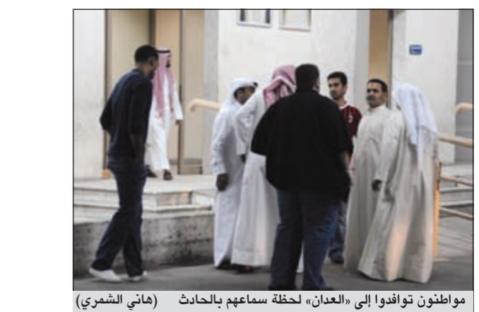
مواطنون توافدوا إلى «العبدان» لحظرة سماعهم بالحادث

عواصم - وكالات: في أول اختبار جدي لهدنة موفد الأمم المتحدة والجامعة العربية كوفي آنان، خرج عشرات الآلاف من المظاهرين السوريين في جمعة أطلقوا عليها «ثورة لكل السوريين» في عدة مدن ومناطق سورية. ورغم تراجع عدد القتلى مقارنة بالأيام السابقة، فإنه سقط ما لا يقل عن 11 قتيلًا برصاص القوات السورية، واستمرت حملة الاعتقالات بين المظاهرين، واتهمت لجان التنسيق المحلية قوات النظام بخرق الهدنة في أكثر من 47 موقعاً. في غضون ذلك وقبل بدء مناقشة مجلس الأمن لمشروع القرار الخاص بإرسال المراقبين الدوليين للتحقق من الالتزام بوقف إطلاق النار، طالب آنان الحكومة السورية بضمان وصول مساعدات إلى أكثر من مليون سوري بحاجة إلى مساعدات إنسانية عاجلة. من جانب آخر، أعلن مسؤولون روس أمس أن القيادة الروسية قررت نشر عدد من السفن الروسية للقيام بدوريات منتظمة بشكل دائم قبالة السواحل السورية.