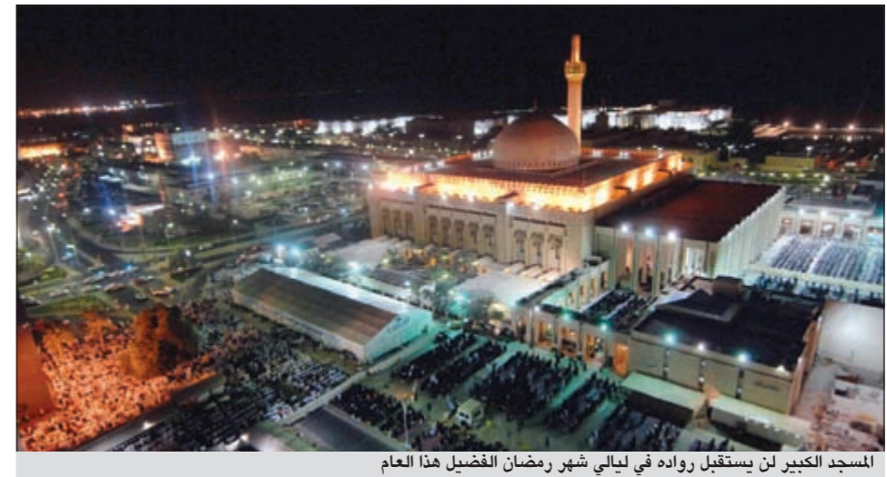
المسجد الكبير لن يستقبل رواده في ليالي شهر رمضان الفضيل هذا العام

القيادة السياسية هتائه بالإنجاز الفهد رئيساً لـ «أنوك» بثقة ساحقة بعث صاحب السمو الأمير الشيخ صباح الاحمد وسمو ولي العهد الشيخ نواف الاحمد وسمو رئيس الوزراء الشيخ جابر المبارك ببرقيات تهنئة الى رئيس المجلس الأولمبي الآسيوي الشيخ احمد الفهد بمناسبة انتخابه رئيساً لاتحاد اللجان الأولمبية الوطنية «أنوك». وكان الفهد قد فاز برئاسة «أنوك» بأغلبية ساحقة أثناء انعقاد الجمعية العمومية الـ 18 للاتحاد في موسكو امس، وحصل على 200 صوت من أصوات اللجان الأولمبية الوطنية التي تمثل 204 دول شاركت في اجتماع الجمعية العمومية. التفاصيل ص 14