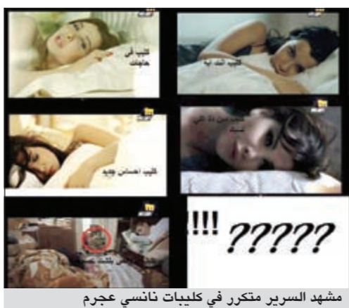
مشهد السرير متكرر في كليبات نانسي عجرم

من يشاهد فيديو كليبات الفنانة نانسي عجرم يلاحظ أن هناك مشهد متكرر يتكرر في أغلبية تلك الأعمال. إنه مشهد نانسي «الأميرة النائمة» التي تستيقظ من النوم في بداية الكليب وهنا نتحدث عن كليبات «انت ابيه، أه ونص، إحساس جديد، مين ده اللي نسيك، في حاجات»، فما سر السرير الذي يرافق نانسي في تصوير جميع كليباتها.