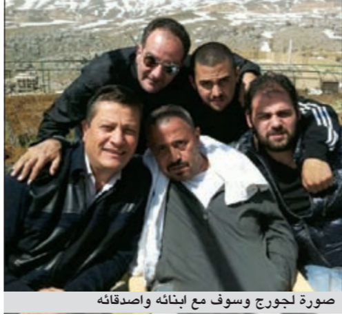
صورة لجورج وسوف مع ابنتائه واصدقائه

نشرت الصفحة الخاصة بشبكة الوسوف ان سلطان الطرب جورج وسوف انتهى من تسجيل البومه الجديد وسيقوم بتسليمه الى شركة «روتانا» للمغنيات والصوتيات قريبا. كما نشرت صور للوسوف تظهر تحسن حالته الصحية من خلال نشر صور تجمعها مع أبنائه واصدقائه أثناء تناولهم الغداء في أحد الأماكن الجبلية حيث تظهر من خلفهم مرتفعات تغطيها الثلوج.