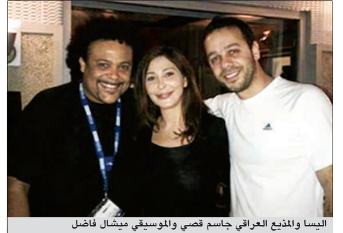
إليسا والمذيع العراقي جاسم قصي والموسيقي ميشال فاضل

أثارت صورة جمعت المطربة اللبنانية إليسا، والمذيع العراقي جاسم قصي والموسيقي ميشال فاضل تعليقات لاذعة طالت الفنانة اللبنانية التي أطلت من دون مكياج، فبدت مختلفة تماما. وظهرت إليسا في الصورة، بحسب ما ذكر موقع «أنا زهرة»، وعلامات التقدم في السن بدت واضحة عليها، وكان وجهها متعبا وفاقدا لنضارتها كأنها استيقظت للتو من النوم. وانتهت التعليقات على تلك الصورة التي اعتبرها البعض دليلا على تقدم إليسا في السن وعدم نفع عمليات التجميل. حتى أن بعضهم قال إنه لم يعرف النجمة للوهلة الأولى.