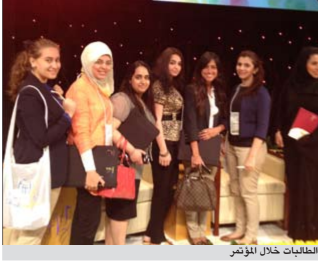
الطالبات خلال المؤتمر