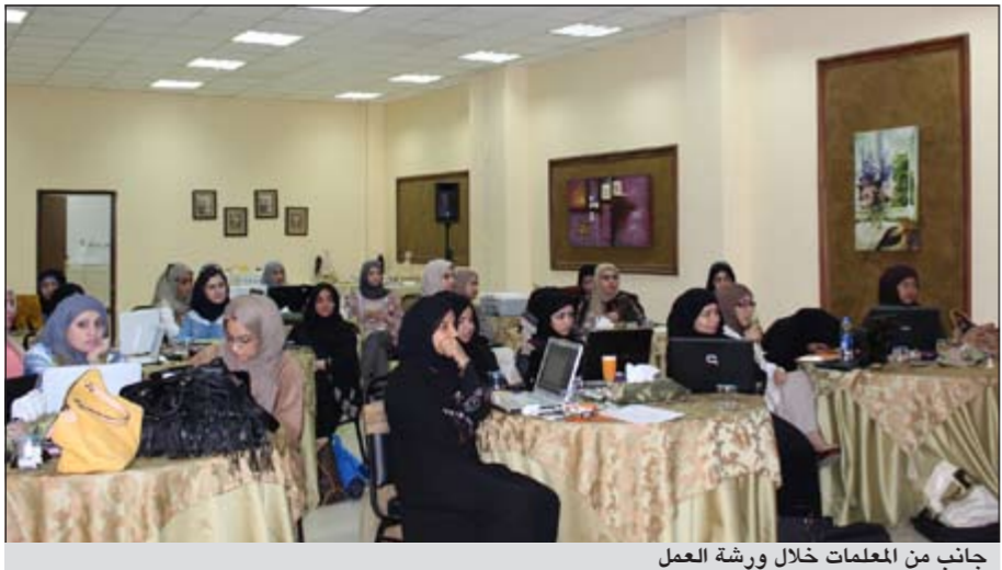
جانب من المعلمات خلال ورشة العمل

فصل الاستاذ، والذي ابدى إعجابهم بأهداف الورشة ودورها في تطوير العملية التعليمية وتشجيع المعلمات على استخدام الحاسوب والوسائل الحديثة في الفصل الدراسي.