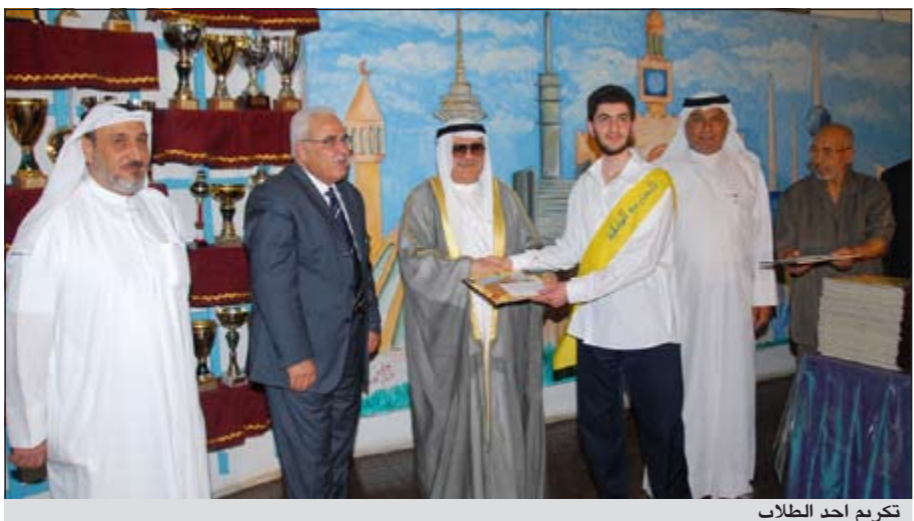
تكريم أحد الطلاب