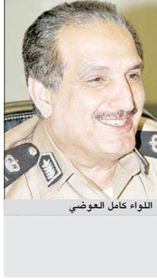
اللواء كامل العوضي