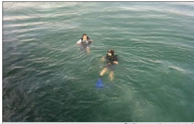
غواصان يبحثن عن جثة الأسوي