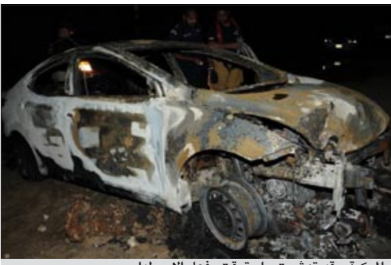
المركبة وقد تهبمت واحترقت بفعل الاصطدام

تقلت جثة وأقد مصري الى الطب الشرعي بعد تفحمها جراء اصطدام سيارته بفوهة حريق على مقربة من المخازن العمومية التابعة لمنطقة الصليبية وسجلت قضية. وفي التفاصيل التي يرويها المصدر فإن بلاغا ورد مساء أمس الأول إلى غرفة عمليات الداخلية من وأقد عربي يفيد بوجود حادث اصطدام واحترق مركبة فتوجه على الفور رجال الأمن بأوامر من مدير أمن الجهاد اللواء ابراهيم الطراح الى موقع البلاغ، حيث وجدت المركبة وقد تحطمت مقدمتها بسبب اصطدامها بفوهة حريق، مما أدى الى احتراق المركبة وقائدها الذي تم إخراجه من قبل رجال الإطفاء ورجال الأمن وتم اسعافه من قبل رجال الاسعاف الى مستشفى الفروانية، حيث لفظ أنفاسه الأخيرة بسبب الحروق التي لحقت به وسجلت قضية اصطدام وحريق ووفاة.