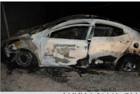
قوة الاصطدام أدت إلى احتراق المركبة