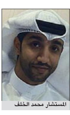
المستشار محمد الخلف

قضت دائرة الجرح المستأنفة برئاسة المستشار محمد الخلف، بإلغاء حكم أول درجة القاضي بحبس طبيب شهرا مع الشغل والنفاذ والأمر بإبعاده عن البلاد بعد تنفيذ العقوبة وقضت بقبول الاستئناف شكلا وفي الموضوع ببراءة المتهم مما هو منسوب إليه.