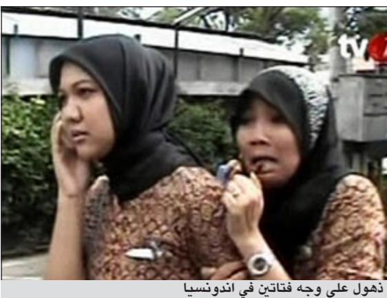
ذهول على وجه فتاتين في اندونيسيا

جاكرتا - يو.بي.سي: ضرب زلزال ثان بقوة 8,2 درجات على مقياس ريختر الساحل الغربي لشمال جزيرة سومطرة أمس، وكانت سلسلة هزات ارتدادية ضربت المنطقة بعد زلزال أول ضربها عام قيل أن قوته 8,9 درجات وعاد المعهد وحفضه إلى 8,6 درجات على مقياس ريختر.