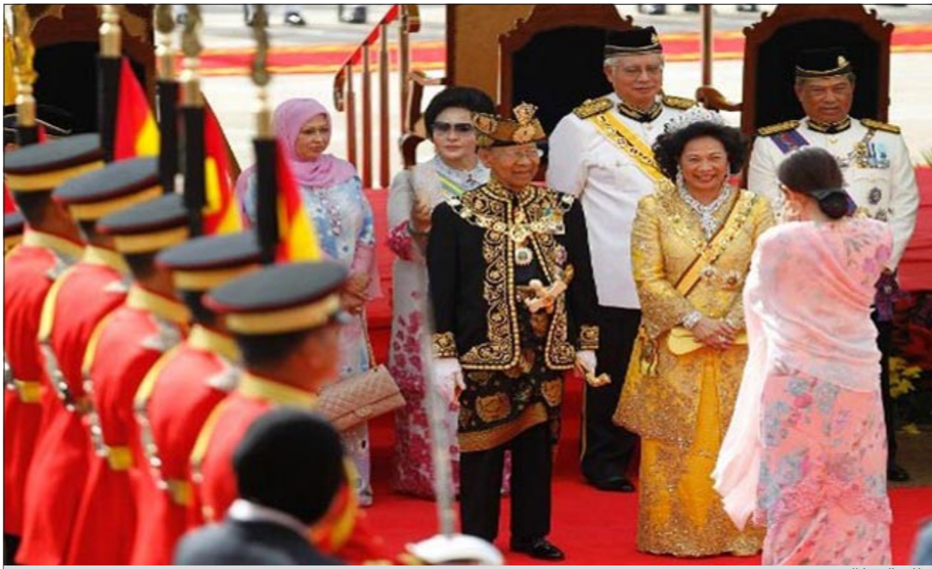
ملك ماليزيا الجديد

الأولى عام 1970. وشهد مراسم التتويج نحو ألف مدعو من بينهم مسؤولون حكوميون وأقرباء من الأسرة الملكية من ولايات ماليزيا أخرى وديبلوماسيون أجانب. ويوصف عبد الحليم بأنه ملك وودود للغاية، ومعروف عنه شغفه بالرياضة ويقال إنه يعشق الجولف وكرة القدم.