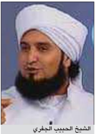
الشيخ الحبيب الجفري

الفلستيني الخطورة، بينما دافع الجفري عنها، وذلك بعد أيام من انتقاد رئيس السلطة الوطنية الفلسطينية، محمود عباس، لفتاوى تحرم زيارة المسجد ومدينة القدس، كان أبرزها تلك الصادرة عن رجل الدين المصري د.يوسف القرضاوي.