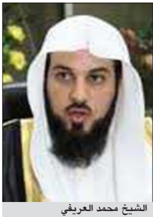
الشيخ محمد العريفي