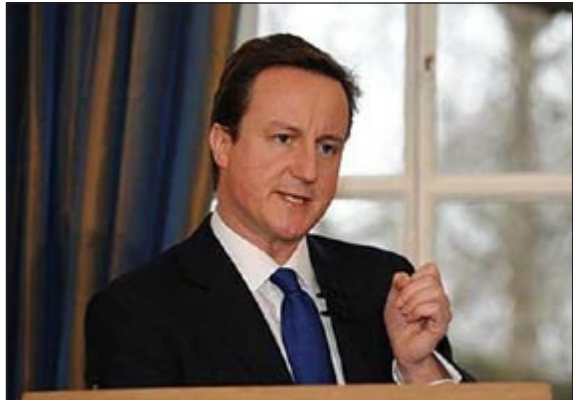
رئيس الوزراء البريطاني ديفيد كاميرون

لندن - يو.بي.سي: أقدم رئيس الوزراء البريطاني ديفيد كاميرون نفسه في موقف مريح بشأن شعاع الوطنية الذي يتناه حين استخدم طائرة أنفولية بجولته في جنوب شرق آسيا.