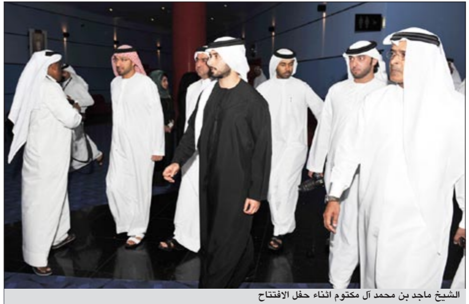
الشيخ ماجد بن محمد آل مكتوم افتناء حفل الافتتاح

المهرجان مسعود امر الله عن اعضاء لجنة التحكيم وجاءت مشيراً ان جوائز التكريم ستستمر وذلك تقديراً ووفاء لمن اعطى لعالم السينما في الخليج تحديدا والعالم العربي بشكل عام.