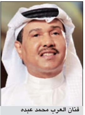
فنان العرب محمد عبده