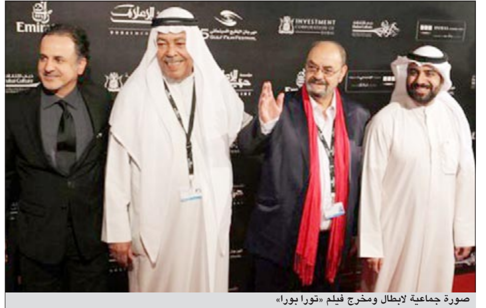
صورة جماعية لإبطال ومخرج فيلم «تورا بورا»