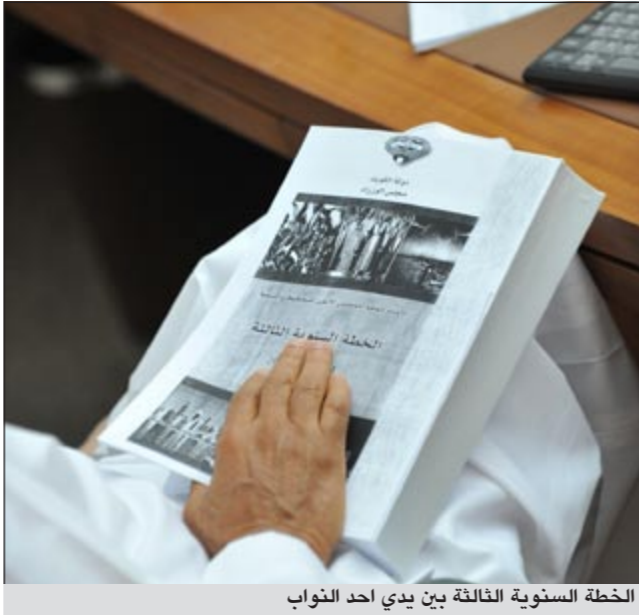
الخطة السنوية الثالثة بين يدي احد النواب