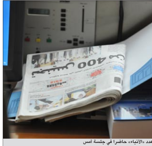
عدد «الأنباء» حاضرا في جلسة أمس