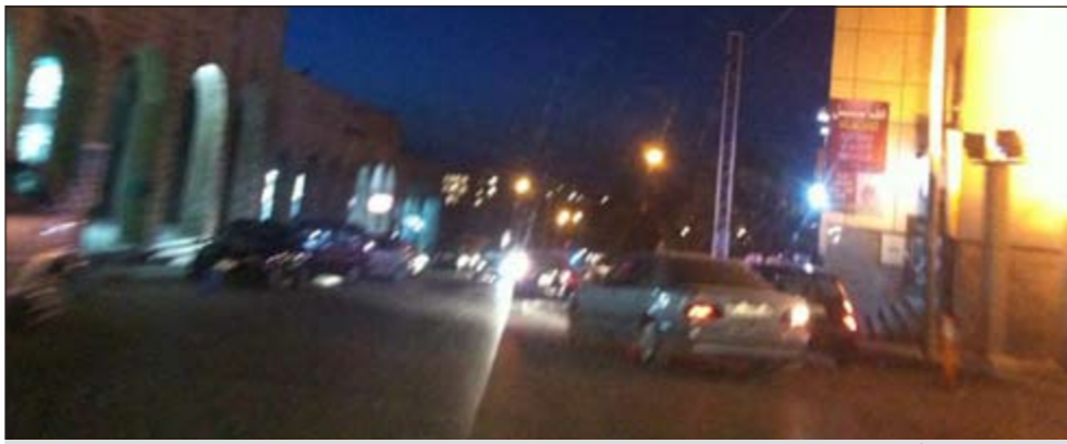
الاضواء هادئة في منطقة الجببية

بسيطة وجار التعامل مع الوضع بمتابعة مع وزارة الداخلية الأردنية. ومن خلال تجول «الأنباء» في شوارع البلدية بمنطقة الجببية بالعاصمة الأردنية كانت الحركة طبيعية جدا ولا توجد اي تجمعات او ما يدعو للقلق، وعند سؤالنا صاحب صالون