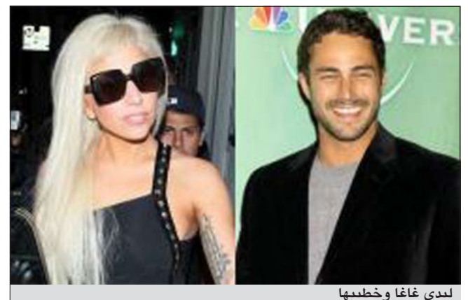
ليدي غاغا وخطيبها

يشار إلى أن ليدي غاغا قدمت إلى حبيبها، قبل الانطلاق في جولتها الموسيقية العالمية هرا شاردا ليذكره بها عندما تكون بعيدة عنه.