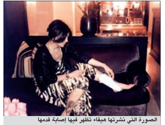
الصورة التي نشرتها هيفاء تظهر فيها إصابة قدمها

اشتكت النجمة اللبنانية هيفاء وهي على حسابها الخاص بموقع تويتر من الخاص بتعليق مقتضب: «الآلم مزعج قليلا.. للعتة على الكعوب».