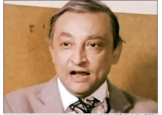
الفنان الراحل فؤاد خليل

يذكر أن «خليل» الذي دخل عالم التمثيل عن طريق «كثيئة» استخدمها، حيث ادعى انه ابن خالة الفنانة شادية، كما صرح مرارا، بدأ مشواره منذ عمر السابعة، ومن أشهر الأدوار التي قدمها الفنان الراحل، دوره في فيلم «الكيف» مع الفنان محمود عبدالعزيز، حيث كان يقدم دور «ستموني» شاعر الأغنيات الشعبية، وارتبط في أذهان الجمهور بجملة «بحك يا ستموني مهما الناس لاموني» التي كان يقولها له محمود عبدالعزيز عندما كان يلقي قصيدة «الغفا».