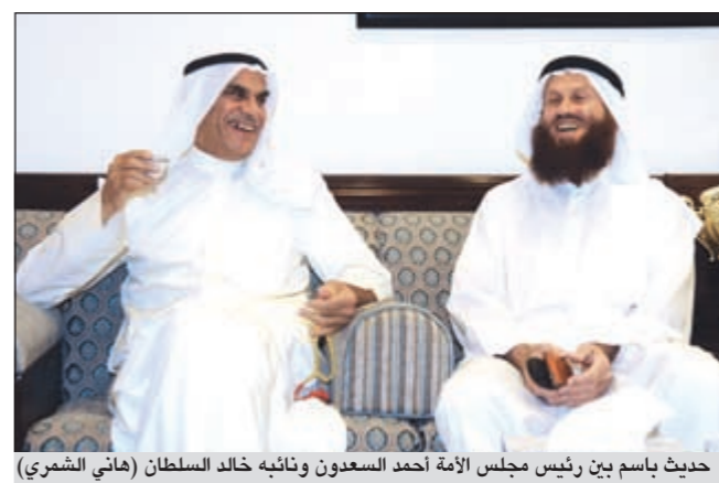
حديث باسم بين رئيس مجلس الأمة أحمد السعدون ونائبه خالد السلطان (هاني الشمري)

وأمس، أعلن رئيس اللجنة التنسيقية لكتلة الأغلبية النيابية النائب د.جمعان الحريش أن اللجنة تدعم وتبني ما جاء في محاور استجواب النائب محمد هايف لوزير الأوقاف جمال الشهاب، والذي أعلن هايف عزمه تقديمه قبل فترة. وقال الحريش في تصريح