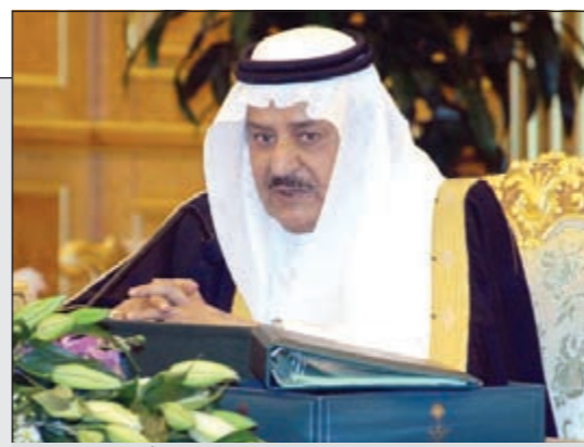
ولي العهد السعودي صاحب السمو الملكي الأمير نايف بن عبدالعزيز