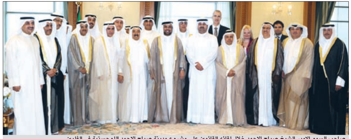
صاحب السمو الأمير الشيخ صباح الأحمد خلال لقائه القائمين على مشروع مدينة صباح الأحمد اللوجستية في الفلبين

إلى ذلك علمت «الأنباء» أن دفعة تجنيس جديدة سيعتمدها مجلس الوزراء قريباً جداً، وكشفت مصادر مطلعة عن تصريحات خاصة لـ «الأنباء» أن كشفاً جديداً يضم 400 اسم من العسكريين على طاولة مجلس الوزراء، الذين شاركوا في حربي 67 و73 وحرب تحرير الكويت، وعن الضوابط التي على أساسها وضعت هذه الأسماء أوضحت المصادر: وجود إحصاء 1965، وعدم حمل جوازات دول أخرى، وعدم وجود قيود أمنية. من جهة أخرى أكدت مصادر حكومية لـ «الأنباء» أن هناك توجهات لمسواة العاملين في الإدارة العامة للتحقيقات بالعاملين في إدارة الفتوى والتشريع اعتماداً على نص المادة رقم 10 من القانون رقم 53 لسنة 2001 بمساواة أعضاء التحقيقات بنظرانهم من النيابة العامة. وقالت المصادر أن هناك مؤشرات إيجابية ظهرت أمس على توجه بموافقة الحكومة على اعتماد علاوة قانونية موحدة لـ «الفتوى» و«التحقيقات» تساوي 70٪ من العلاوة القضائية، نظراً للامتعاض الكبير بين صفوف العاملين في الإدارة العامة للتحقيقات، وتأكيدهم أنه من غير المعقول مساواتهم بالقانونيين من البلدية الذين حصلوا على الزيادة من العام الماضي.