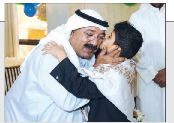
الشيخ ناصر صباح الأحمد مصافحا أحد الأيتام

ولي العهد السعودي يعود إلى المملكة اليوم بعد فحوصات طبية في أميركا ويأمر بإطلاق السجناء 'غير الخطرين' 49