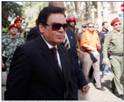
.. ويشي وراء عمر سليمان أثناء تقديمه أوراق الترشيح للرئاسة