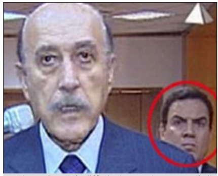
العقيد حسين وراء عمر سليمان أثناء خطاب نخي مبارك

رئيس الجمهورية السابق، أثناء نزوله من السيارة، بعد تدافع عدد من مؤيديه، محاولة منهم للوصول إليه. ورافقه أثناء دخوله مقر اللجنة وسط ترقب شديد لكافة المحيطين باللواء عمر سليمان حرصا على سلامته وتأمينه الشخصي.