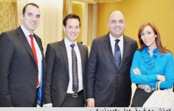
كوتش مع فريق عمل «كمبينيكي»

مقارنة مع العام 2010، متوقعا أن تشهد مبيعات العام 2012 مزيداً من النمو، خاصة مع المؤشرات التي تؤكد ذلك، حيث بدأت نسبة الإشغال في الفنادق الشريكة بالقاهرة في التزايد. وأوضح أن مبيعات فنادق المجموعة في الإمارات العربية المتحدة أيضاً تزايدت خلال العام 2011، وهو الأمر الذي يدعو إلى التفاؤل. وحول نية المجموعة افتتاح فندق في الكويت أكد كوتش أن السوق المحلي لا يستوعب مزيداً من الفنادق، خاصة مع معدلات