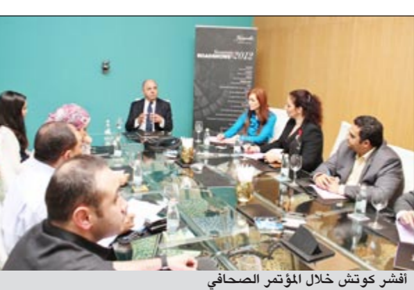
أفشر كوتش خلال المؤتمر الصحفي

الإشغال المتدنية التي تشهدها الفنادق الحالية. وذكر أن المجموعة المتخصصة في مجال الضيافة أعلنت عن نتائج إيجابية في الربع الأول من العام 2012 لمخلفتها المتنامية من الفنادق والجمعيات السكنية المارة في منطقة الشرق الأوسط، فقد حققت فنادق كمبينيكي في كل من الإمارات والبحرين وقطر نسب إشغال أعلى من المتوقع خصوصاً خلال عطلات نهاية الأسبوع بما يعكس نسب النمو المتزايد في السياحة الداخلية بين بلدان المنطقة. ولغت إلى أنه في ظل خطط المجموعة لافتتاح 5 منشآت فندقية جديدة في دول المجلس، فإن المجموعة واثقة من أنها ستستمر في تحقيق المزيد من النتائج الإيجابية في المنطقة. وبشارك في الجولة التي تقوم بها فنادق كمبينيكي كل من فندق فيبر جارسيزيتين كمبينيكي مونيخ وفندق كمبينيكي باهيا في ماربيلا وفندق ستافورد بلندن وفندق شيرخان بالاس في اسطنبول. حيث استعرضت هذه الفنادق عرضاً ترويجية خاصة صممت للعلطة الصيفية المقبلة بما يتلاءم مع احتياجات الضيوف من المنطقة متضمنة التهيئة المائلية للغرف واشتراقات مجانية في اندية مخصصة لأنشطة الأطفال وأندية صحية راقية وقوائم للطعام الحلال. وقد وصلت جولة كمبينيكي الترويجية الإقليمية السنوية إلى الكويت بعد توقفها في جدة والرياض والخبر والبحرين والدوحة، وستختتم هذه الجولة في أبوظبي.